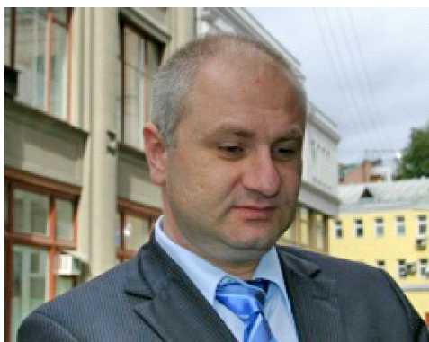
На фото: М. Евлоев

Магомед Евлоев был убит 31 августа 2008 года. Он прибыл утренним рейсом из Москвы в аэропорт Магаса (Ингушетия), где его взяли под стражу. Магомед Евлоев открыто противостоял тогдашнему президенту Ингушетии Мурату Зязикову и являлся владельцем независимого оппозиционного сайта Ingushetiya.ru, который в настоящий момент закрыт. На сайте выкладывались статьи с жёсткой критикой ингушских властей, которые пытались закрыть сайт. Как стало известно, сотрудники правоохранительных органов Ингушетии задержали Магомеда Евлоева в аэропорту около 13:40, усадили его в машину и увезли. Примерно в 14:10 его доставили с огнестрельным ранением головы в республиканскую больницу в Назрани (Ингушетия), где он впоследствии скончался.