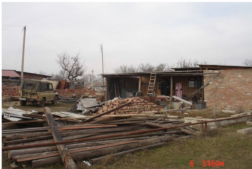
Фотографии посёлка КСМ-1, известного как «Шанхай», сделанные перед его сносом

В 2007 году власти города заявили, что упомянутые семьи живут в этом месте незаконно, в условиях антисанитарии. Однако у этих семей никогда не было полноценного жилья, и проживали они в тех домах, которые им удалось самостоятельно построить за время двух войн. В апреле 2007 года власти попытались снести посёлок, но после вмешательства правозащитных организаций семьям выделили участки, в том числе в посёлке Андреевская долина.