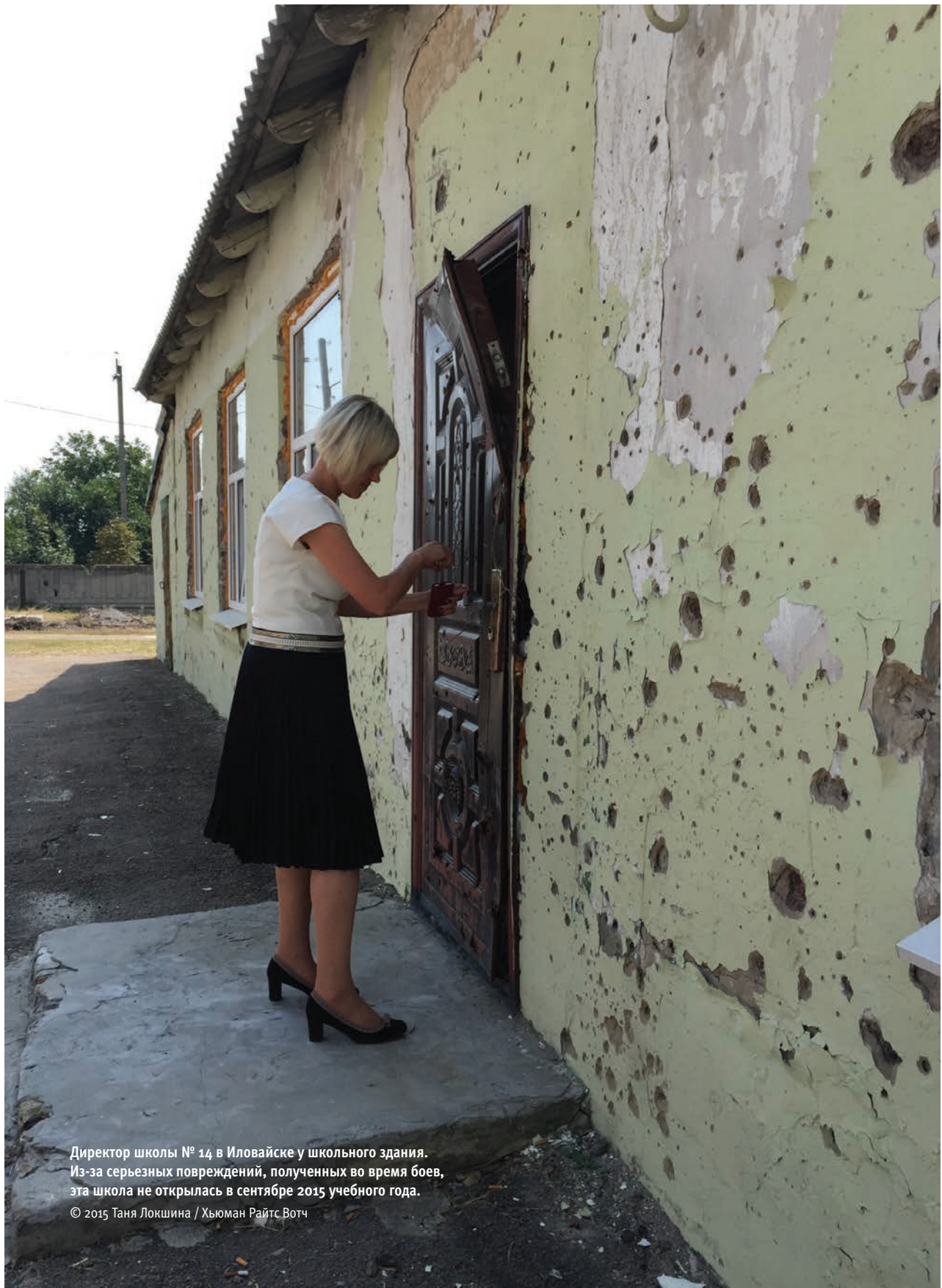
Директор школы № 14 в Иловайске у школьного здания. Из-за серьезных повреждений, полученных во время боев, эта школа не открылась в сентябре 2015 учебного года.