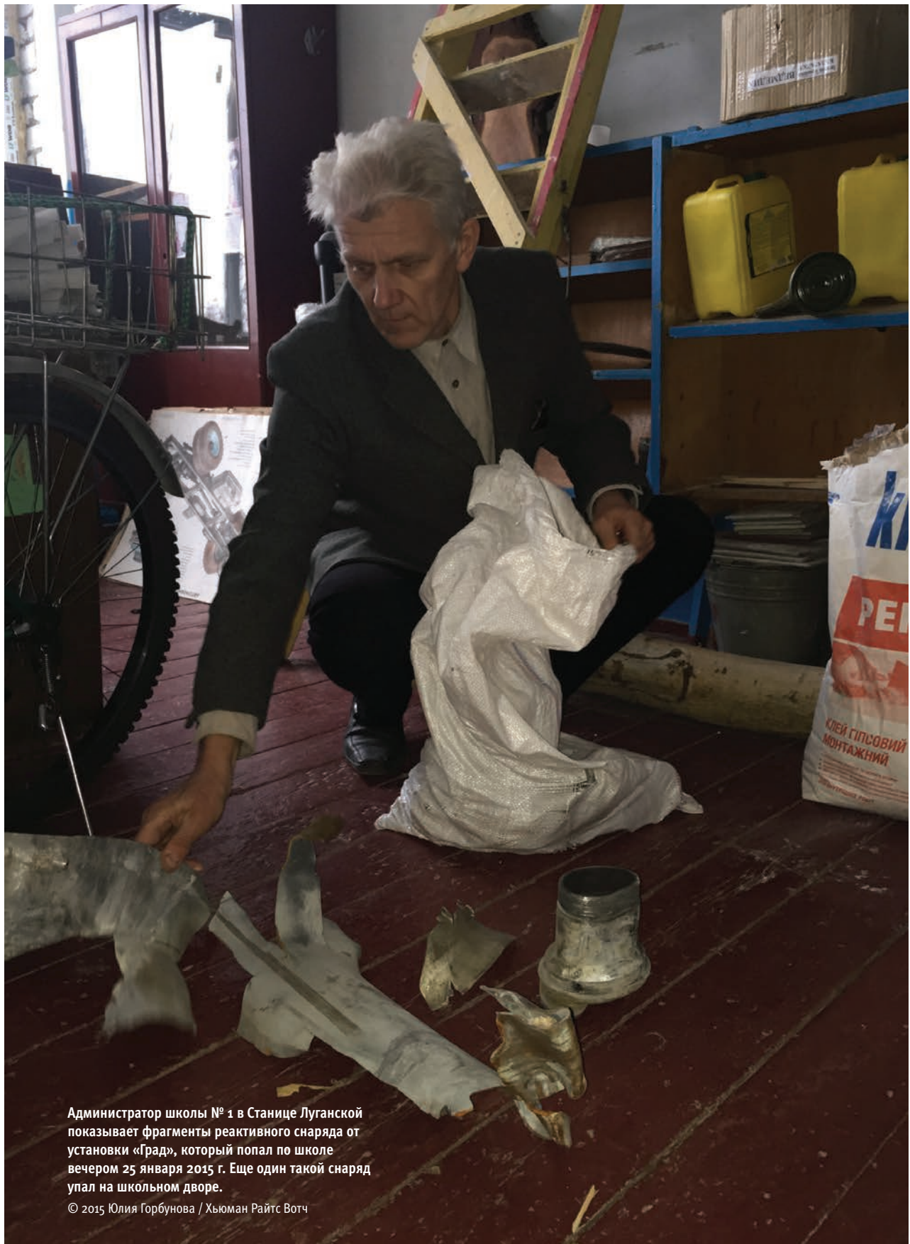
Администратор школы № 1 в Станице Луганской показывает фрагменты реактивного снаряда от установки «Град», который попал по школе вечером 25 января 2015 г. Еще один такой снаряд упал на школьном дворе.