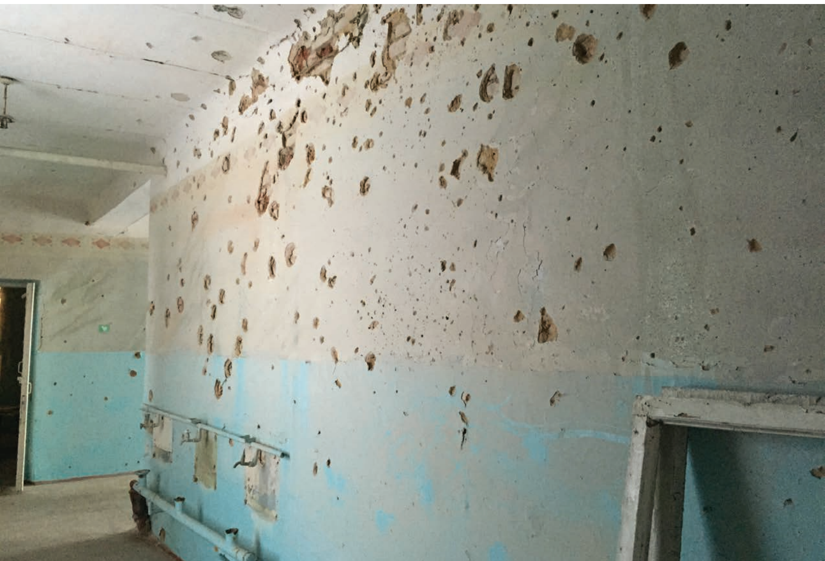
Коридор школы № 3 в Красногоровке со следами от осколков.