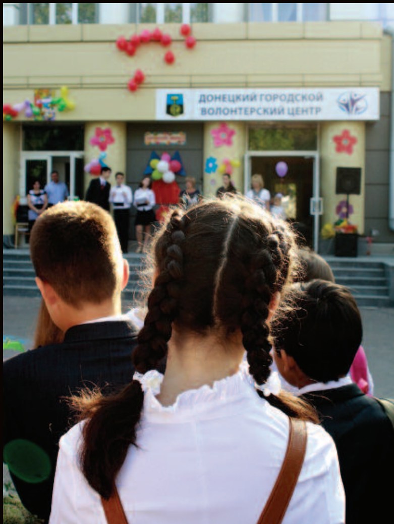
(вверху) «Первый звонок» в школе № 2 в контролируемом ополченцами Донецке, 1 сентября 2015 г.

Хьюман Райтс Вотч настоятельно призывает и украинские власти, и поддерживаемые Россией антиправительственные силы прекратить все нападения на школы, которые не являются законными военными целями, и избегать развертывания контингента и вооружений в школах, детских садах и поблизости от них. Украинские власти в интересах недопущения использования школ в военных целях должны присоединиться к Декларации ООН о безопасности школ.