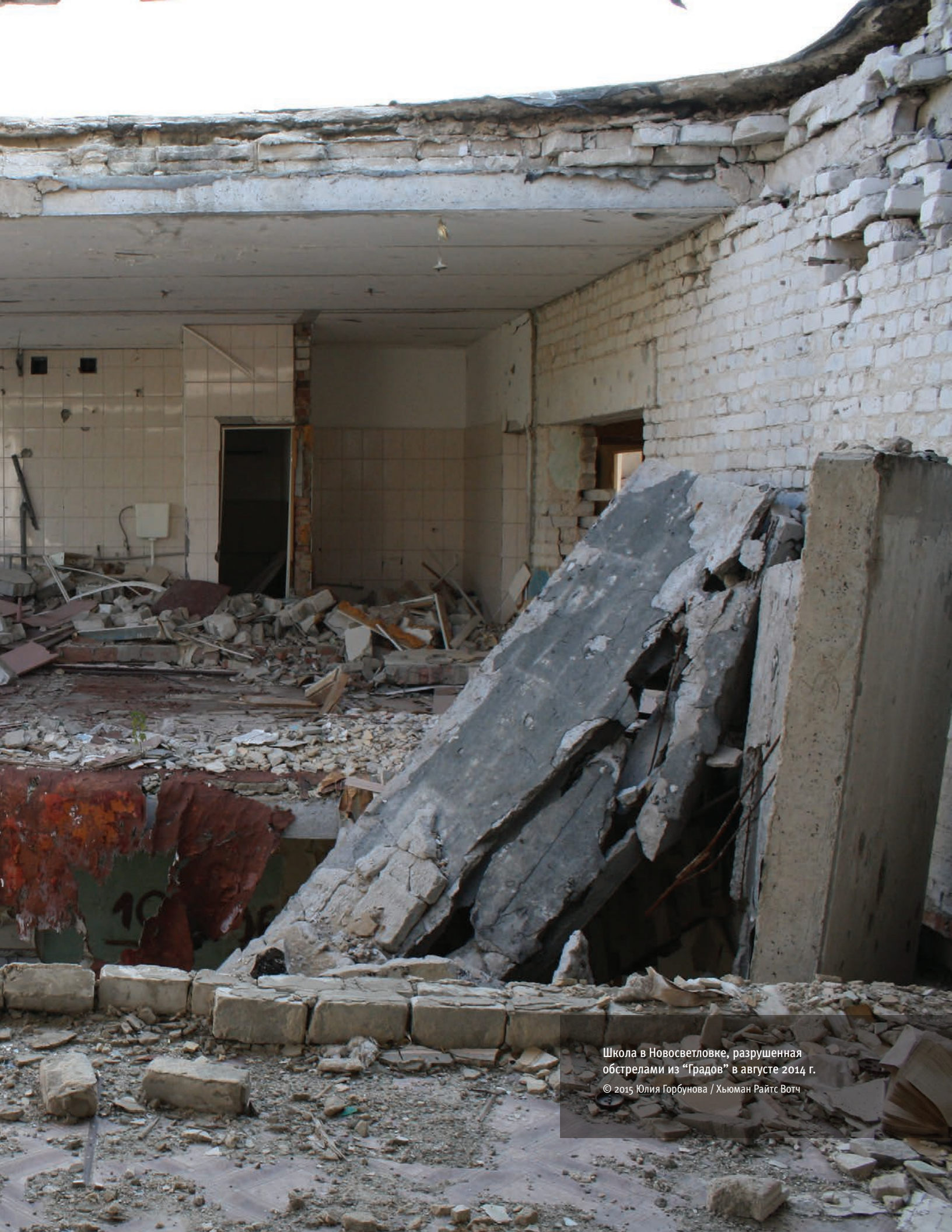
Школа в Новосветловке, разрушенная обстрелами из "Градов" в августе 2014 г.