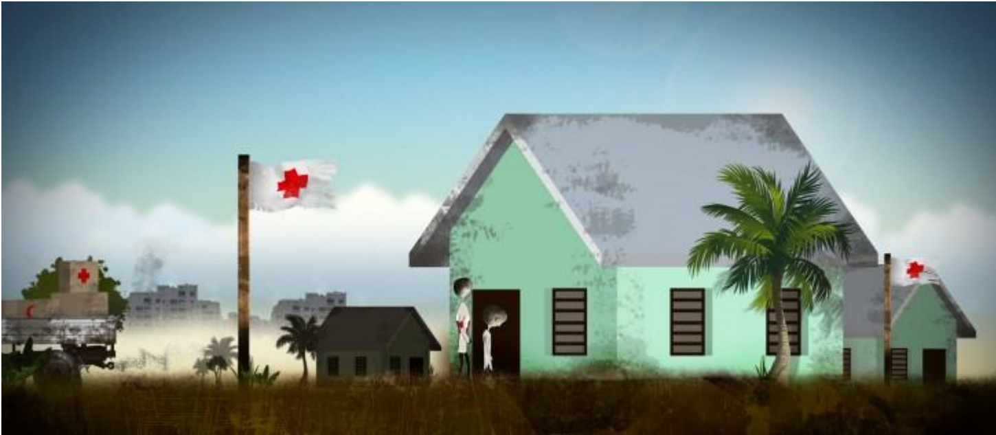
Деятельность Международного Комитета Красного Креста в интересах жертв сексуального насилия

Главное свойство сексуального насилия - его незаметность, которая зачастую является следствием чувств вины, стыда, страха перед возмездием или культурных табу, которые во многих случаях не дают жертвам обратиться за помощью. По этой причине в 2013 г. МККК избрал упреждающий подход, решив действовать с учетом предположения о том, что сексуальное насилие имеет место во время всех вооруженных конфликтов и других ситуаций насилия, если только в ходе детальной оценки не было доказано обратное. В условиях высокого распространения сексуального насилия МККК предлагает, насколько это возможно, придерживаться многопрофильного подхода, оказывая психологическую и психосоциальную помощь, выдавая направления на лечение и оказывая материальную помощь. Одновременно с этим активизируется работа по защите и превентивная деятельность путем диалога с участниками вооруженных групп, проведения кампаний по повышению информированности и привлечению внимания общественности, а также выстраивания партнерских отношений с сообществами с целью развития и укрепления совместных механизмов защиты, призванных снизить подверженность риску.