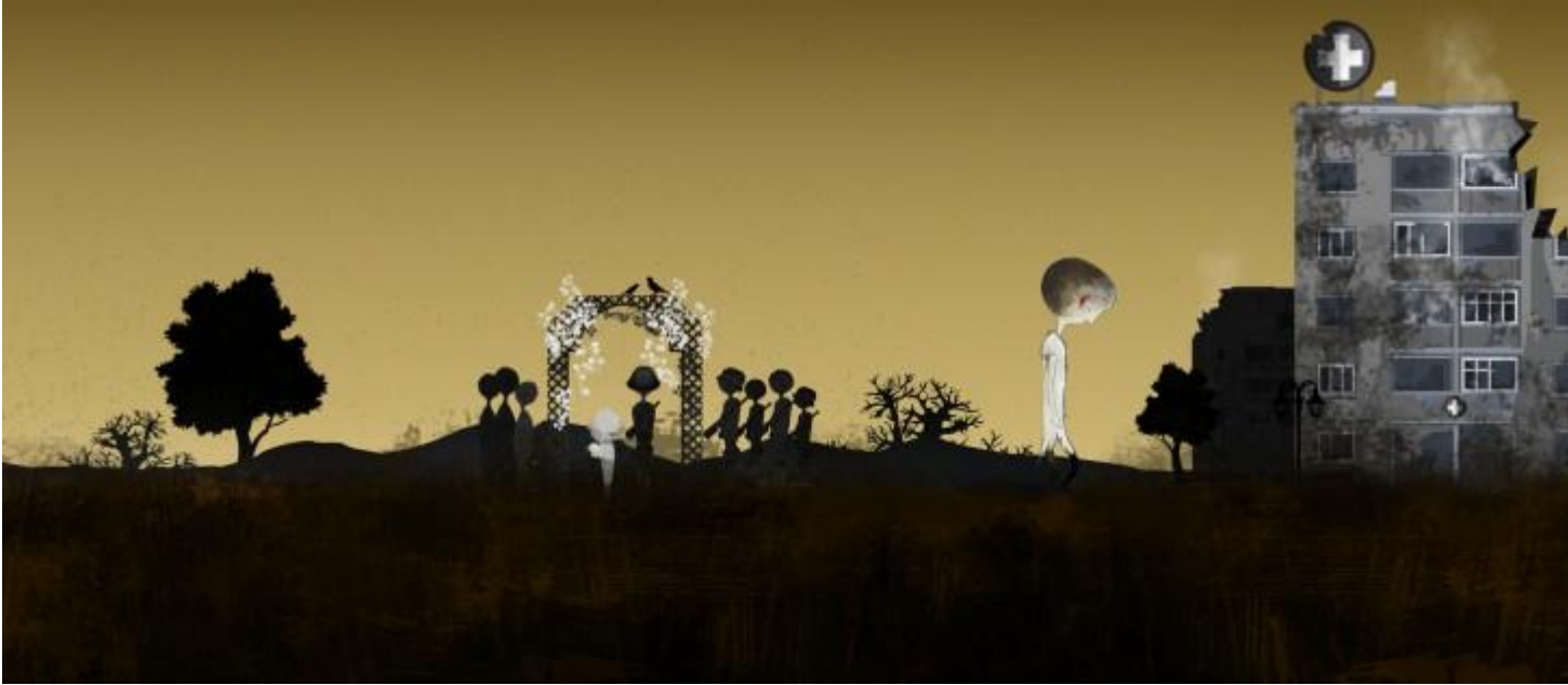
Принуждение к вступлению в брак во время вооруженных конфликтов

Термин "сексуальное насилие" используется для обозначения действий сексуального характера, совершенных в отношении женщин, мужчин, девочек или мальчиков с применением силы, угрозы силой, либо путем принуждения, которое может быть вызвано угрозой насилия, грубым принуждением, лишением свободы, психологическим давлением или злоупотреблением властью. Среди прочего к сексуальному насилию относятся изнасилование, обращение в сексуальное рабство, принуждение к проституции и принудительная беременность. Изнасилование и прочие формы сексуального насилия запрещены правом прав человека при любых обстоятельствах, а также запрещены нормами международного гуманитарного права во время как международного, так и немеждународного вооруженного конфликта. Данный запрет обязаны соблюдать как государства, так и негосударственные акторы. Изнасилование и прочие серьезные формы сексуального насилия, совершенные во время вооруженного конфликта или в связи с ним, представляют собой военное преступление и должны преследоваться по закону. В иных обстоятельствах сексуальное насилие нередко также запрещено нормами национального права.