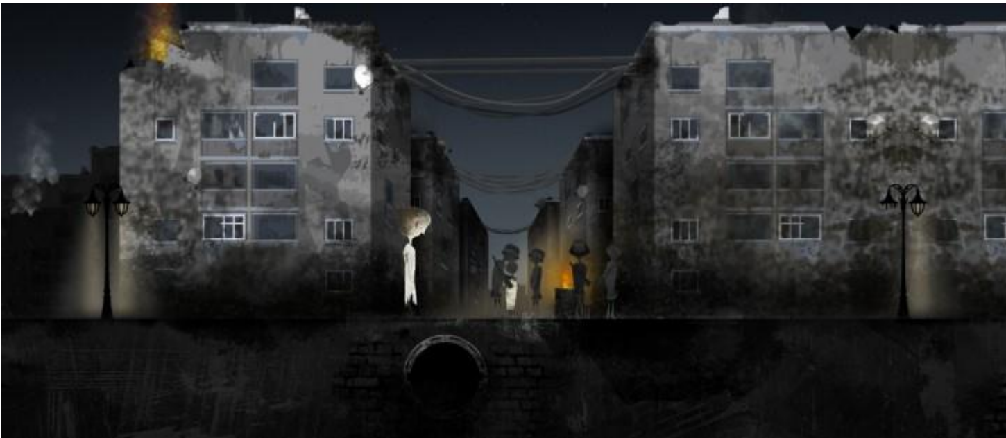
Принуждение к проституции и обращение в сексуальное рабство во время вооруженных конфликтов

Вопреки распространенному убеждению, сексуальное насилие не ограничивается рамками определенных регионов или культур. На протяжении всей истории оно имело место на всех континентах, и его жертвами становились женщины, мужчины, девочки и мальчики, гражданские лица и лица, содержащиеся под стражей, внутренне перемещенные лица, мигранты и беженцы. Сексуальное насилие в условиях вооруженного конфликта часто связано с другими формами насилия: убийством, принудительной вербовкой, уничтожением собственности и грабежом. Сексуальное насилие может иметь под собой различные мотивы, в том числе использоваться в качестве репрессалий или пытки, для запугивания и контроля населения или как стратегия ведения войны. Последствия сексуального насилия для конкретных лиц, их семей и сообществ могут носить физический, психологический, социальный и экономический характер. Физический вред может включать в себя увечья и боль, заболевания и инфекции, передающиеся половым путем, риск бесплодия и нежелательной беременности, а к психологическому ущербу могут относиться стресс, чувство стыда и изоляция, расстройства сна и пищевого поведения, а также депрессия. Нередко предвзятое отношение и отторжение со стороны семей и сообществ имеют серьезные социальные и, следовательно, экономические последствия.