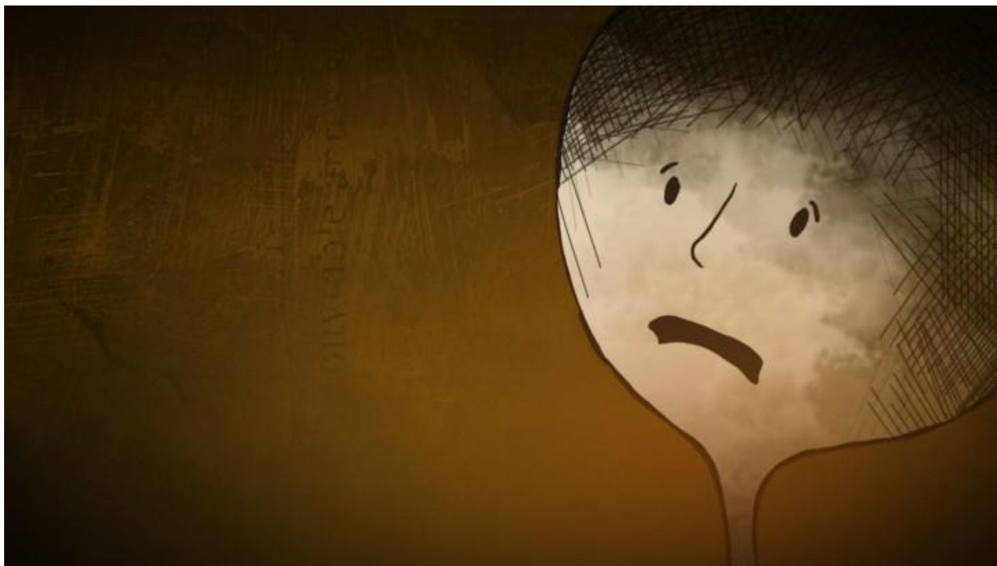
Решая проблему сексуального насилия

Вооруженные конфликты и другие ситуации насилия по-разному сказываются на женщинах, мужчинах, девочках и мальчиках. Вместе с тем, сексуальное насилие, которое все еще широко распространено во время большинства современных конфликтов, имеет пагубные последствия для всех жертв, независимо от возраста и пола, а также для их семей и целых сообществ.