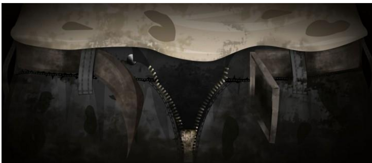
Сексуальное насилие во время вооруженных конфликтов

В 2013 г. Международный Комитет Красного Креста (МККК) обязался сделать решение проблемы сексуального насилия институциональным приоритетом (на 2013-2016 гг.), чтобы укрепить меры по предотвращению сексуального насилия и помощи жертвам. Сегодня в брюссельских кинотеатрах стартовал анимационный фильм МККК, призванный привлечь внимание европейской аудитории к проблеме сексуального насилия в условиях вооруженного конфликта.