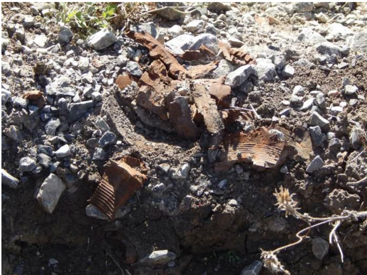
Рядом со зданием школы № 1