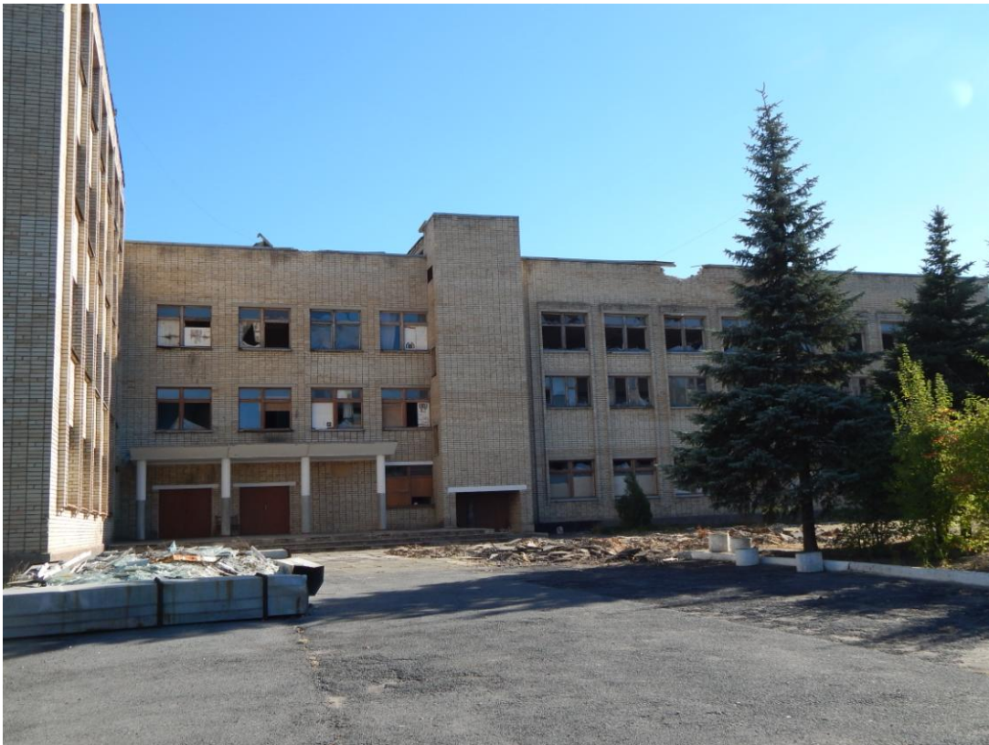
Здание школы № 1