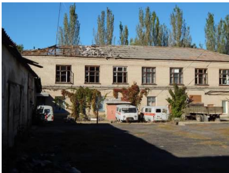
Больница в Красногоровке, последствия обстрелов.