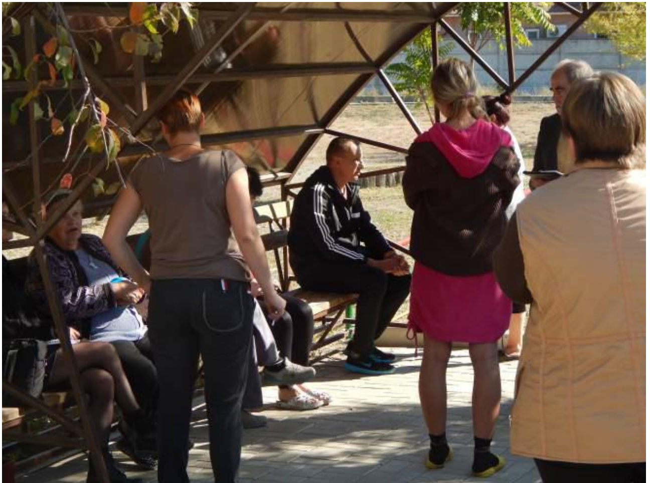
Святогорск. Во время встречи с временно перемещенными лицами