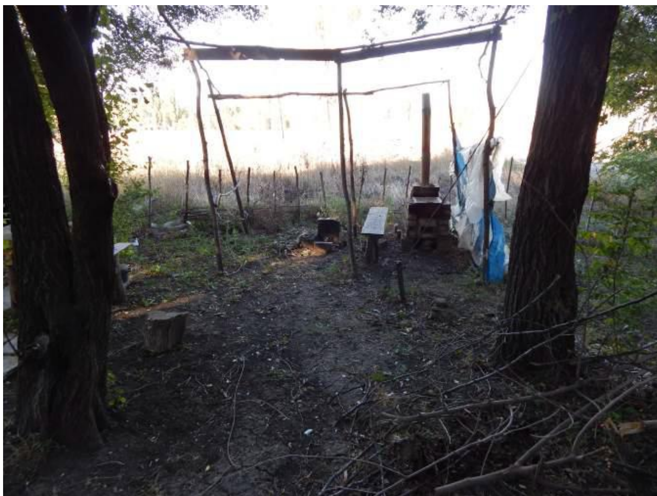
Тут жители одного из многоквартирных домов готовят себе пищу

Город значительно пострадал в ходе боевых действий. Разрушения видны везде. Создается впечатление об отсутствии в городе неповрежденных домов. Есть сложности с восстановлением. По восстановлению в городе еще работы не производились. Люди сами ремонтируют, то, что можно отремонтировать. Стройматериалы предоставляют волонтеры. Проезд в город затруднен, в городе пропускной режим. Завозить стройматериалы можно только с разрешения военного командования по специальным пропускам. Даже гуманитарную помощь – и то провозить сложно. Продукты завозят по предварительному заказу, после тщательного контроля, сверяясь с накладными. Частный бизнес вести очень сложно. Работы в городе практически нет. Воду, после 10 месяцев отсутствия, наконец, пустили, но пить ее нельзя – она «техническая». Зимой в городе не было центрального отопления – ставили буржуйки. Но уголь – большая проблема для Красногоровки. Топили печи дровами. Начали вырубать зеленые насаждения, которыми город был раньше богат. Все, с кем мы разговаривали, «боятся зимы». Необходимы газовые баллоны, уголь, дрова. А провезти их сложно, нужен пропуск.