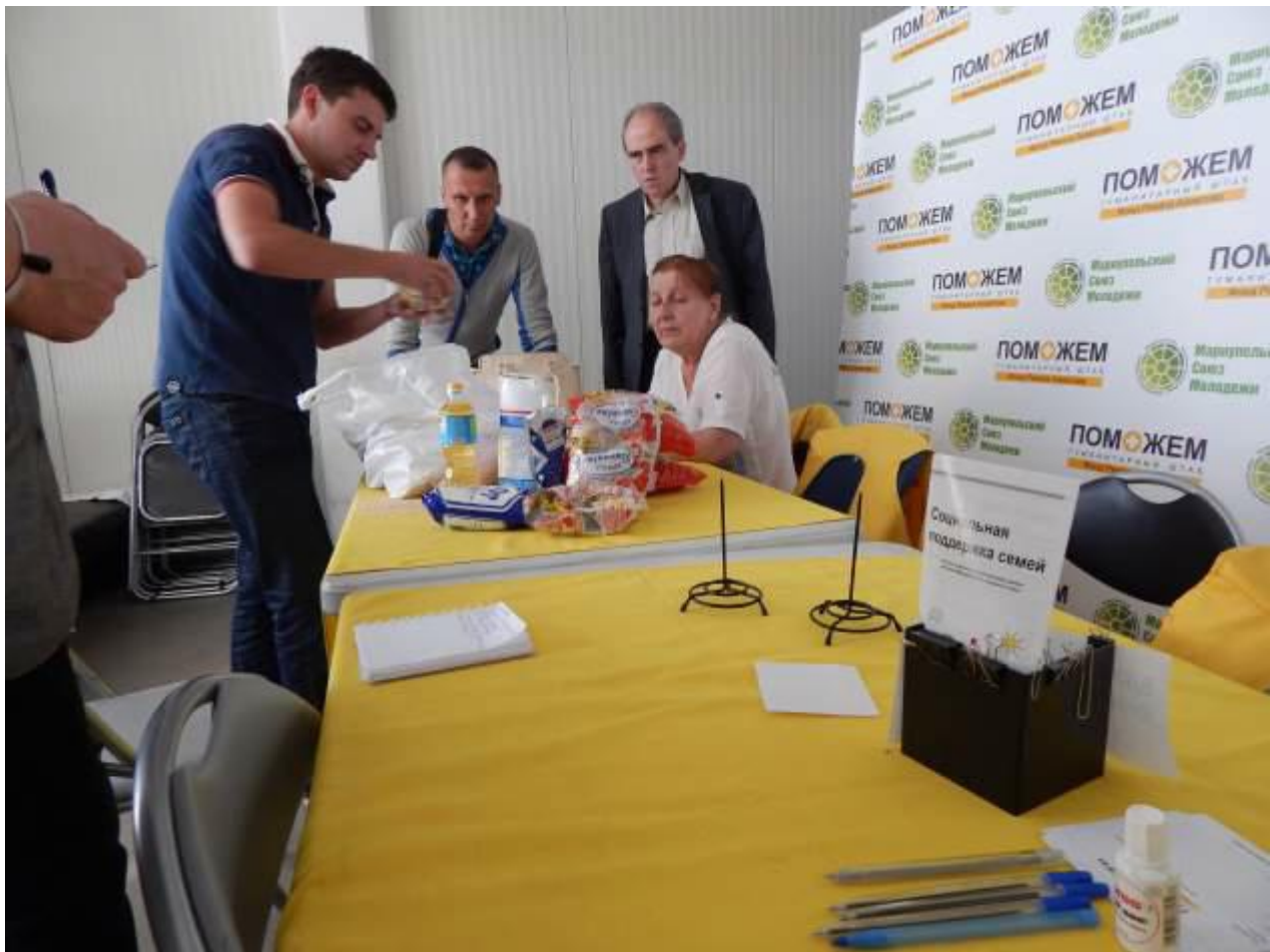
В логистическом центре Фонда Рината Ахметова в Мариуполе

В колонне обычно – 25 тыс. продуктовых пакетов. Колонны, как правило, приходят 2 раза в месяц. Всего было 28 колонн.