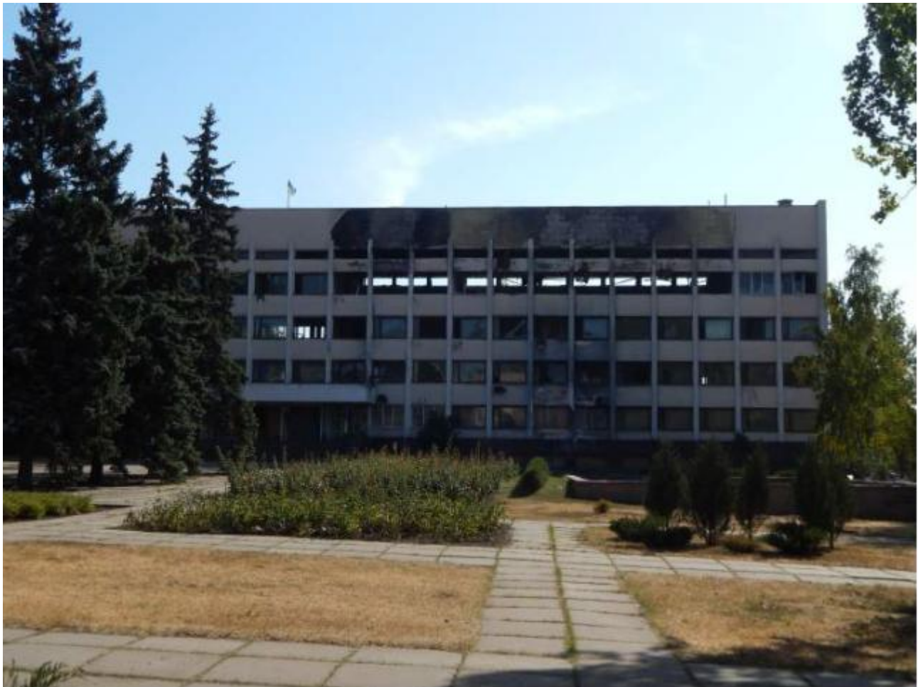
Городской Совет Мариуполя

Возле бывшего сожженного пожаром здания горсовета стоят палатки под украинскими флагами, где активисты собирают пожертвования на защиту Украины.