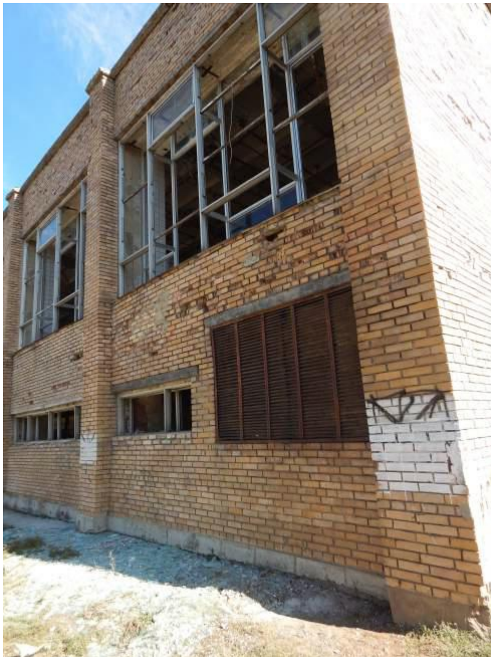
Марьинка. Спортзал школы № 1

В 2014 году была попытка вывезти школу-интернат для детей-сирот, находившуюся в Марьинке, в Россию. Но все 54 ребенка после переговоров омбудсменов России и Украины вернулись в Украину. Позже в школе стояли украинские военнослужащие. В июне 2015 года здание школы было серьезно повреждено и в настоящее время не может использоваться.