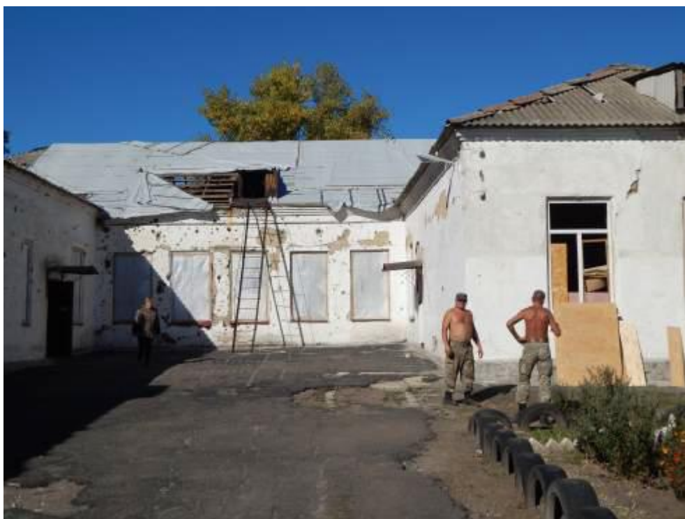
Военные пытаются спасти здание школы № 3