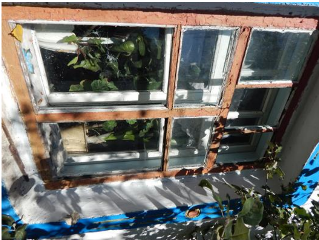
Осколок мины пробил стекло и влетел в дом

Улица 8-го марта , параллельная ул. Лермонтова. В доме № 21 31-го августа здесь была ранена в ногу женщина.