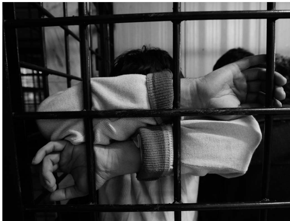
Задержанный нелегальный мигрант из одной из стран бывшего Советского Союза ожидает в камере в отделении полиции в сибирском городе Красноярск. сентябрь 2013.

Для практических целей необходимо также отметить дополнительные и решающие различия между меньшинствами, которые имеют «славянскую» и «неславянскую» внешность. Хотя это различие и не является однозначным, ксенофобские настроения, как правило, нацелены, прежде всего, на людей с более темной кожей и, особенно на выходцев с Кавказа и Центральной Азии, а также цыган, хотя порой они также нацелены на африканцев, китайцев и др. Лица, которые также являются лицами без гражданства, помимо того, что они имеют «неславянскую внешность», находятся в положении повышенной уязвимости.