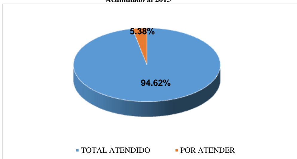
Gráfico N° 1 Nivel de avance en el PRE Acumulado al 2015