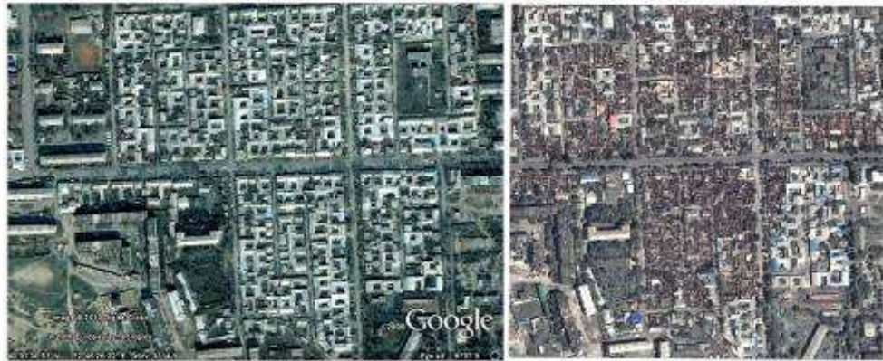
Состояние зданий в ошском районе Черёмушки в 2007 и 2010 году (Кыргызстан). Здания без крыш уничтожены пожарами.

повреждённые районы; 18 июня 2010 года. Спутниковые фотографии опубликованы и проанализированы Американской ассоциацией содействия развитию науки (AAAS) и программой Amnesty International «Наука за права человека». Они иллюстрируют страшные последствия недавних беспорядков в городе Ош на юге Кыргызстана.