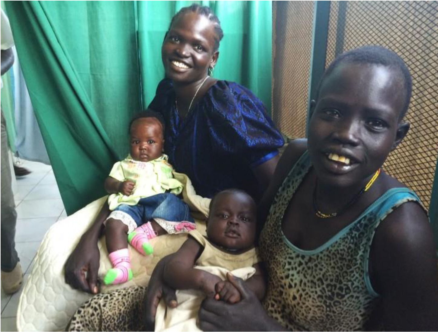
Две матери улыбаются во время осмотра в медицинском учреждении округа Майвут в Южном Судане. Молодые матери могут получить здесь дородовую и послеродовую медицинскую помощь, в частности, благодаря программам, которые финансирует МККК.