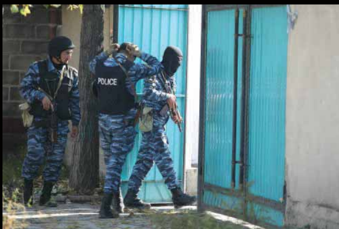
Антитеррористическое подразделение во время обыска в Бишкеке 16 октября 2015 г.

Преследование за хранение экстремистских материалов характерно для всех государств Центральной Азии, власти которых стремятся не допустить укоренения в регионе вооруженных экстремистских группировок, таких как «Исламское государство». Мы признаем обязанность любого правительства обеспечивать защиту всем лицам в пределах его юрисдикции, однако нарушения прав человека при этом недопустимы и могут обернуться отчуждением между властью и местными сообществами.