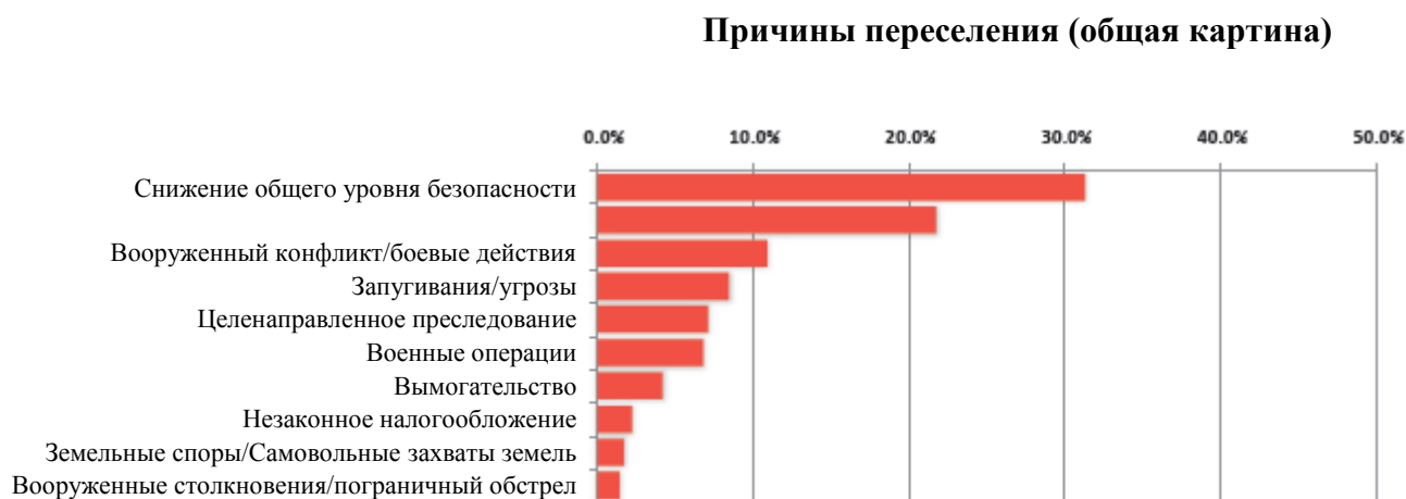
Рис. 2: Причины внутреннего перемещения в Афганистане.

В июле 2012 года представителем УВКБ ООН был представлен отчет о вынужденных переселенцах в Афганистане. В списке главных причин перемещения «запугивание и угрозы» стояли на третьем месте, «целенаправленное преследование» – на четвертом, «незаконное налогообложение» – на седьмом (см. Рис. (2) ( 119 )).