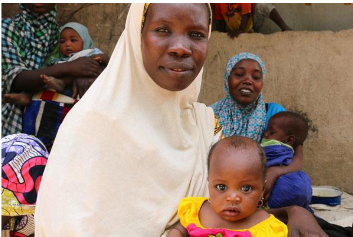
«Здесь много таких же женщин, как я», - добавляет мать четверых детей.