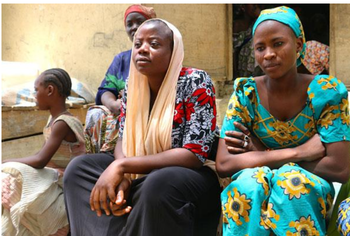
Большинство людей, находящихся здесь, прибыли из недоступных мест, сильно пострадавших от насилия «Боко Харам». Каждый десятый человек, вынужденный бежать от «Боко Харам» (всего их около