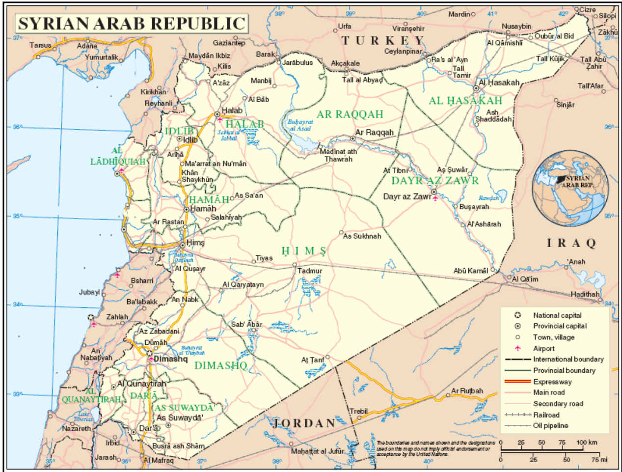
Map No. 4204 Rev. 2 UNITED NATIONS May 2008

Department of Field Support Cartographic Section