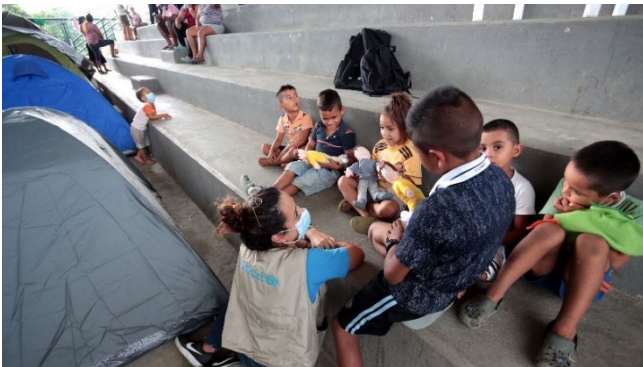
Foto: 1. Municipio de Arauquita. Situación de emergencia. Acompañamiento del sector de educación para atender necesidades identificadas. 2021

Adicionalmente, el sector apoyó la construcción de planes de retorno escolar de manera presencial, en temas pedagógicos y de infraestructura y lineamientos de bioseguridad, y se ha capacitado a funcionarios y docentes en pedagogía y apoyo socioemocional, considerando las afectaciones en la salud mental causadas por el confinamiento, el cierre de escuelas y la pandemia.