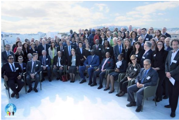
Всемирная конференция МАСЗБ, г. Афины, Греция, ноябрь - декабрь 2017 г

Делегация судей из стран ИКСУ приняла участие в 11-й Всемирной конференции МАСЗБ (Международной ассоциации судей в сфере права о защите беженцев), которая проводилась с 29 ноября по 1 декабря в Афинах. Судьи из Армении, Азербайджана, Грузии, Молдовы и Украины также посетили предконференционные учебные занятия для среднего и углубленного уровня изучения. Участникам из стран ИКСУ обеспечивался синхронный перевод на русский язык, чтобы полностью охватить темы предконференционных учебных занятий, организованных РОПЗ.