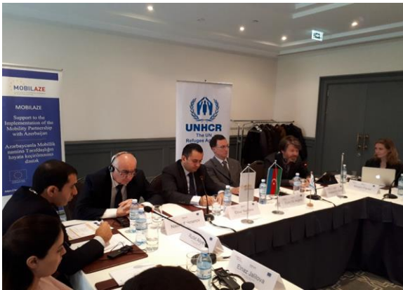
Семинар по ИСП в г. Баку, 20 ноября 2017 г.

Семинар по ИСП в г. Баку, 20-21 ноября 2017 г.