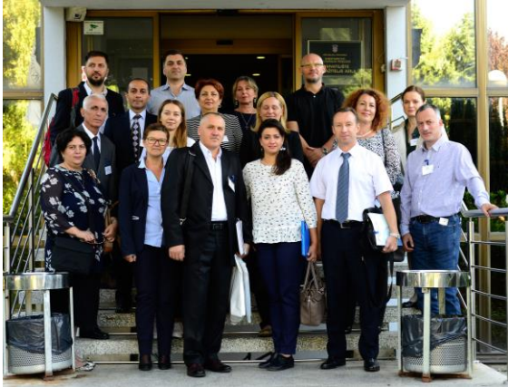
Участники ознакомительной поездки, г. Загреб, Хорватия, 4 - 7 сентября 2017 г.

Хорватия, которая многими ищущими убежища рассматривается как транзитная страна, была выбрана в качестве направления для ознакомительной поездки в связи с ее сходством со странами региона ИКСУ в плане количества искателей убежища, бюджетных средств, выделяемых на вопросы убежища, и экономического положения страны.