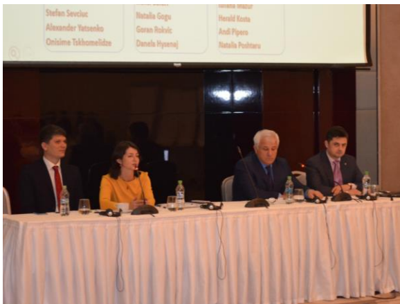
Докладчики Конференции, Молдова, октябрь 2017 г.

Региональный отдел содействия правовой защите (РОПЗ), Национальный совет по юридической помощи Молдовы (НСЮП) и представительство УВКБ ООН в Молдове совместно провели конференцию для практикующих юристов, задействованных в предоставлении правовой помощи искателям убежища и беженцам посредством государственных программ правовой помощи, а также для практикующих юристов, работающих с юридическими НПО. Признано, что провайдеры правовой помощи играют крайне важную роль в создании устойчивой и функционирующей системы предоставления убежища в любой стране. Традиционно УВКБ ООН уделяет значительное внимание вопросу разработки комплексных государственных систем правовой помощи, в рамках которых искателям убежища и беженцам может быть предоставлена качественная правовая помощь и которые обладают необходимыми для этого ресурсами. Потому цель этого тренинга состояла в том, чтобы продемонстрировать опыт Молдовы в создании возможностей и структуры для предоставления качественной правовой помощи через государственного провайдера