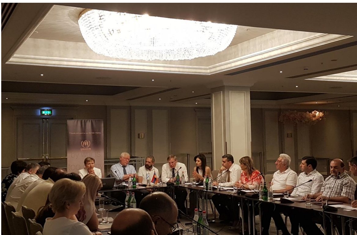
УВКБ ООН Армения, 3 июля

Были рассмотрены также возможности межведомственного сотрудничества судей Армении с их коллегами в Германии в плане обмена информацией о странах происхождения. Затем обсуждались такие темы как тонкости методов ведения опроса, заключения экспертов и наличие права на получение международной защиты в случае ходатайств о предоставлении статуса беженца в связи с сексуальным насилием. Особое внимание уделялось рассмотрению убедительных причин, обусловленных жестоким преследованием в прошлом в качестве основания для получения статуса беженца в таких случаях. Подчеркивалась также вероятность будущего вреда вследствие предыдущего сексуального насилия в качестве основания для получения статуса беженца.