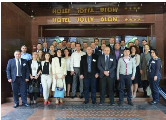
Участники региональной конференции, 15 мая 2017 г.

Первая региональная конференция для сотрудников пограничной службы на тему: доступ к процедуре и механизмы выявления, а также учебная поездка 15-18 мая 2018 года проводилась под эгидой ИКСУ в Кишиневе, Молдова. Впервые за время реализации проекта ИКСУ конференция была организована исключительно для пограничников и собрала почти 40 представителей пограничных служб, а также сотрудников УВКБ ООН из Армении, Азербайджана, Беларуси, Грузии, Молдовы и Украины.