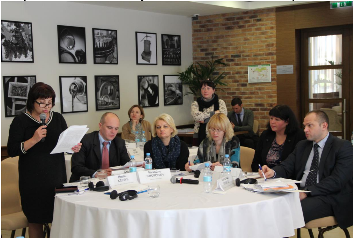
Участники семинара для судей в Киеве, Украина, 20 апреля 2017 г.

Семинар был организован в Киеве 20-21 апреля. В семинаре приняли участие 25 судей всех трех инстанций административных судов из 11 регионов Украины (окружной суд, апелляционный суд и Высший административный суд). Мероприятие было организовано при поддержке Международной ассоциации судей в сфере законодательства о беженцах (IARLJ). На семинаре свои презентации представили европейские судьи, члены Международной ассоциации судей в сфере законодательства о беженцах: г-жа Кателин Деклерк, Президент Ассоциации, Бельгия, г-н Себастьян де Грут, суд первой инстанции г. Хаарлем, Нидерланды, проф. Боштьян Залар, старший судья высшего суда, административный суд Республики Словения.