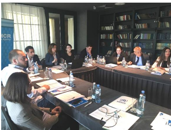
УВКБ ООН Грузия, 21 апреля

ОБСУЖДЕНИЕ ЗА КРУГЛЫМ СТОЛОМ ДЛЯ СОТРУДНИКОВ МИНИСТЕРСТВА ВНУТРЕННИХ ДЕЛ, МИНИСТЕРСТВА ИСПОЛНЕНИЯ НАКАЗАНИЙ И УПРАВЛЕНИЯ ПО РАЗВИТИЮ ГОСУДАРСТВЕННЫХ УСЛУГ НА ТЕМУ: «ЗАКОН ГРУЗИИ О МЕЖДУНАРОДНОЙ ЗАЩИТЕ»