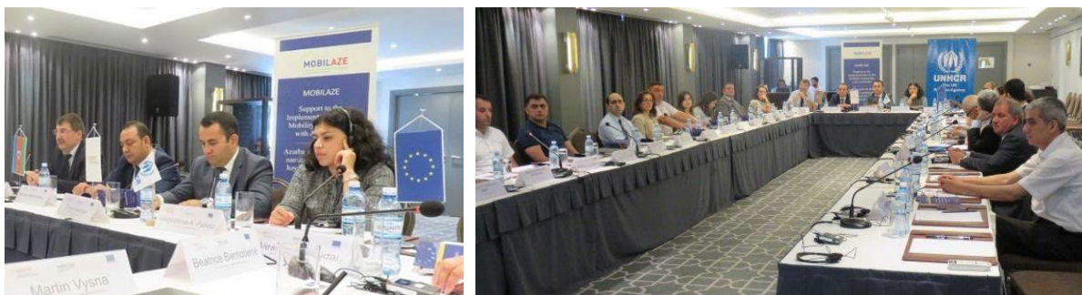
Участники семинара в Баку, 29 июня 2017г.

Совместный семинар УВКБ ООН и Международного центра по разработке миграционной политики на тему интеграции беженцев при участии экспертов из ЕС был проведен 29-30 июня 2017 года в Баку, Азербайджан. Семинар был организован в рамках проекта УВКБ ООН ИКСУ, а также Проекта MOBILAZE (Поддержка реализации мобильного партнерства с Азербайджаном) Международного центра разработки миграционной политики, который финансируется Европейским Союзом (ЕС).