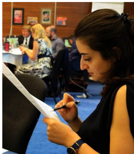
Участники семинара для судей, 15 июня 2017 г.