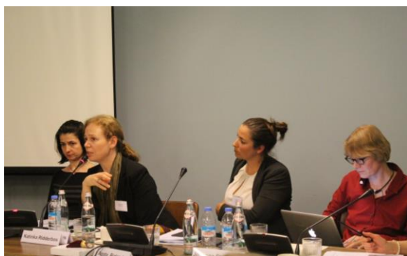
Презентаторы ИСП семинара

Качество информации о стране происхождения остается одним из трех основных моментов ИКСУ. Работа в отношении информации о стране происхождения в рамках ИКСУ началась на первом этапе проекта с запуском базы данных ИСП на русском языке. На первом этапе проекта правительства стран-участниц инициировали создание подразделений по изучению ИСП и координационных центров при административных органах их стран, принимающих решения в первой инстанции. Наличие материалов на русском языке и улучшение структур по изучению ИСП привели к усовершенствованию навыков соответствующих государственных чиновников и принимающих решения сотрудников в плане изучения и подготовки информации о стране происхождения, а также к общему повышению качества ИСП, используемой в процедурах определения статуса беженца.