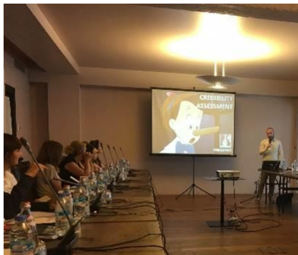
УВКБ ООН Грузия, 12 июня

Венгерского Хельсинкского комитета, редактор и соавтор хорошо известной