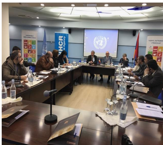
Участники круглого стола, Ереван, Армения

ОБСУЖДЕНИЕ ЗА КРУГЛЫМ СТОЛОМ СТАТЬИ 31 КОНВЕНЦИИ О СТАТУСЕ БЕЖЕНЦЕВ В ЕРЕВАНЕ, АРМЕНИЯ