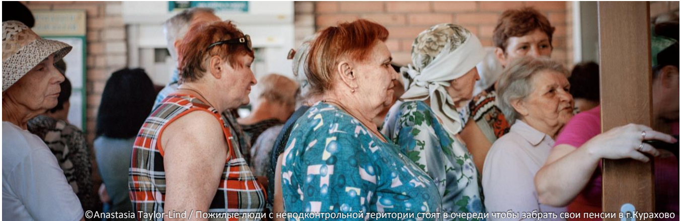
Пожилые люди с неподконтрольной территории стоят в очереди чтобы забрать свои пенсии в г. Курахово

В КЛАСТЕР ПО ВОПРОСАМ ЗАЩИТЫ ВХОДЯТ СУБКЛАСТЕРЫ ПО ВОПРОСАМ ЗАЩИТЫ ДЕТЕЙ, ГЕНДЕРНО-ОБУСЛОВЛЕННОГО НАСИЛИЯ И ПРОТИВОМИННОЙ ДЕЯТЕЛЬНОСТИ