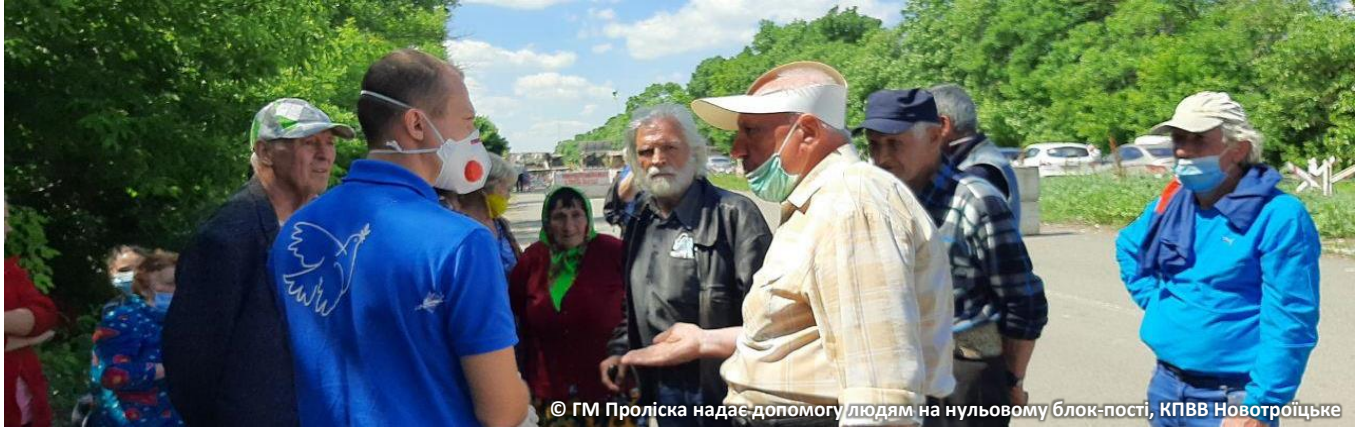
© ГМ Проліска надає допомогу людям на нульовому блок-пості, КПВВ Новотроїцьке

ДО КЛАСТЕРУ З ПИТАНЬ ЗАХИСТУ ВХОДЯТЬ САБКЛАСТЕРИ З ПИТАНЬ ЗАХИСТУ ДІТЕЙ, ҐЕНДЕРНО-ЗУМОВЛЕНОГО НАСИЛЬСТВА ТА ПРОТИМІННОЇ ДІЯЛЬНОСТІ