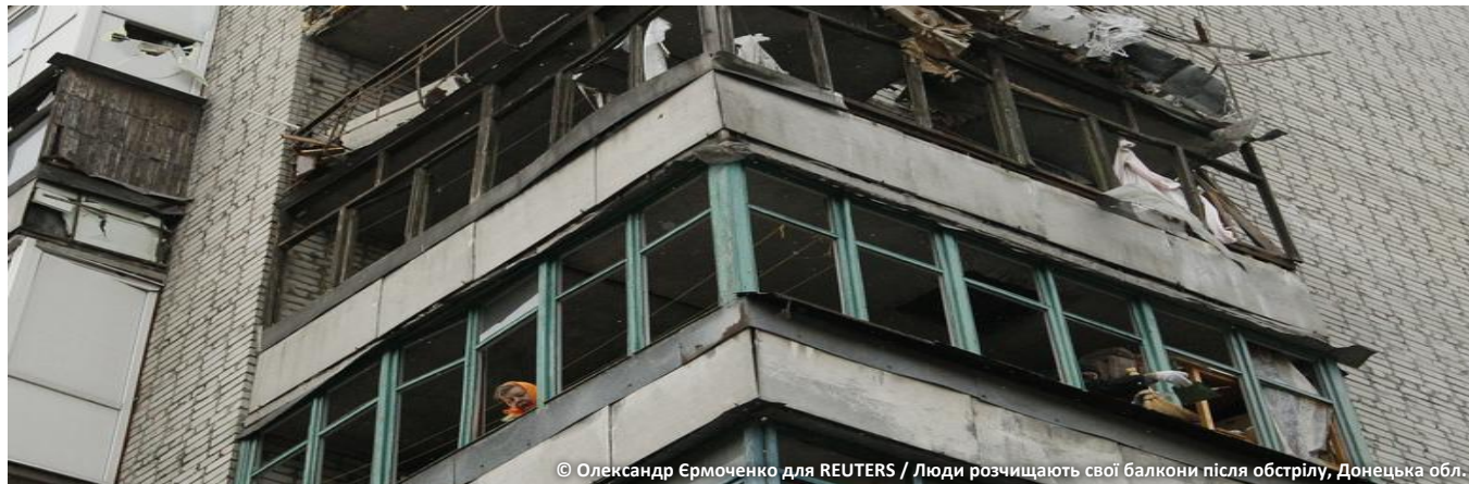
Люди розчищають свої балкони після обстрілу, Донецька обл.