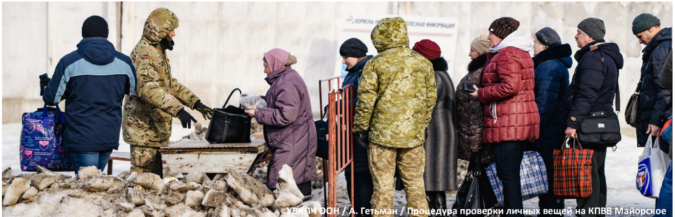
Процедура проверки личных вещей на КПВВ Майорское

В КЛАСТЕР ПО ВОПРОСАМ ЗАЩИТЫ ВХОДЯТ СУБКЛАСТЕРЫ ПО ВОПРОСАМ ЗАЩИТЫ ДЕТЕЙ, ГЕНДЕРНО-ОБУСЛОВЛЕННОГО НАСИЛИЯ И ПРОТИВОМИННОЙ ДЕЯТЕЛЬНОСТИ