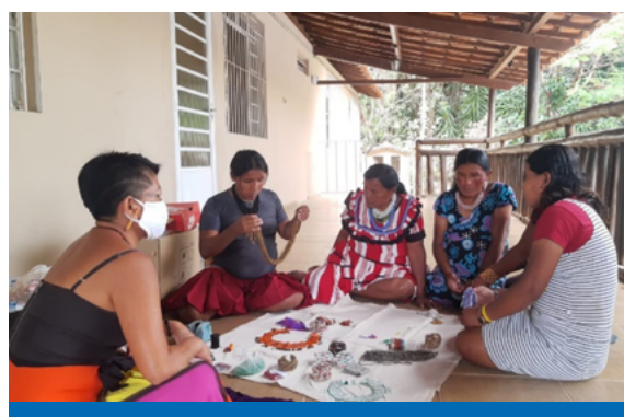
Coexistência pacífica - mulheres Warao em oficina de artesanato e empreendedorismo com indígena ticuna em Belo Horizonte: apoio do SJMR BH e do Comitê Indígena Mineiro fruto do GT Warao.

Em 26 de janeiro, o ACNUR São Paulo realizou a capacitação de 74 funcionários da Superintendência Regional da Caixa Econômica Federal (CEF) em Belo Horizonte. Em parceria com o Comitê Indígena Mineiro e o Serviço Jesuíta para Migrantes e Refugiados (SJMR), a formação abordou a temática do deslocamento forçado, migração e povos indígenas (Warao e de outras etnias), sendo fruto de recomendação expedida pela DPU e pelo MPF para responder a barreiras de acesso a serviços da CEF por indígenas Warao. A demanda deriva do Grupo de Trabalho multi-atores, instituído para apoiar a proteção e integração de famílias Warao em Belo Horizonte. Em 04 de fevereiro de 2020, o ACNUR capacitou também 15 funcionários da rede pública da assistência social de Montes Claros, em parceria com a OIM. A capacitação abordou a cultura Warao, desafios, diretrizes e práticas exitosas na assistência à essa população. Desde novembro de 2019, 267 indígenas Warao foram acompanhados pelo ACNUR São Paulo, por meio de Grupos de Trabalho nas cidades de Belo Horizonte, Campinas/Hortolândia, Montes Claros, Nova Iguaçu/Japeri, Rio de Janeiro, São Paulo e Uberlândia.