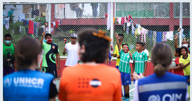
ACNUR, UNICEF, UNFPA, OIM, Prefeitura de Manaus, Instituto Mana e Aldeias SOS realizam mobilizações para os 16 Dias de Ativismo no Abrigo Tarumã-Açu, que acolhe refugiados indígenas Warao em Manaus.

Recepção e Apoio da Rodoviária de Manaus (PRA), Abrigo de Trânsito de Manaus (ATM) e o Posto de Documentação e Interiorização (PITRIG). Juntos os espaços já apoiaram mais de 12.370 refugiados e migrantes com serviços de documentação e 9.515 com interiorização até novembro de 2020.