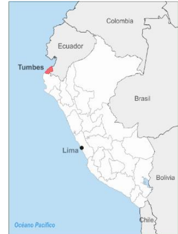
Ubicación del departamento de Tumbes

La Comisión de Relaciones Exteriores del Congreso, sostuvo una sesión extraordinaria, para analizar la situación actual de la frontera norte. Miembros del congreso y el gobernador regional de Tumbes solicitaron la apertura de la frontera, siguiendo todos los protocolos de seguridad con el fin de gestionar de manera más efectiva los flujos irregulares y la aplicación de sanciones migratorias e inadmisiones y reactivar la economía del sector comercial de Aguas Verdes.