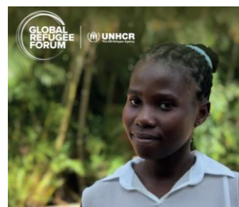
EDUCATION Global Framework for Refugee Education

Le premier Forum Mondial sur les Réfugiés se tiendra à Genève les 17 et 18 décembre. Il se concentrera sur six thèmes : les dispositions relatives au partage des charges et des responsabilités, l'éducation , l'emploi et les moyens de subsistance, l'énergie et les infrastructures, les solutions et la capacité de protection.