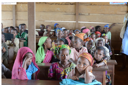
Ecole du site aménagé de au cours de la visite conjointe - Site de Gado - septembre 2017