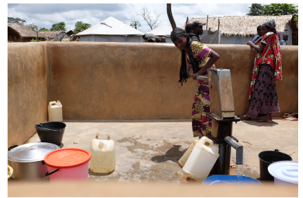
Point d'eau du site aménagé au cours de la visite conjointe - Site de Gado - septembre 2017