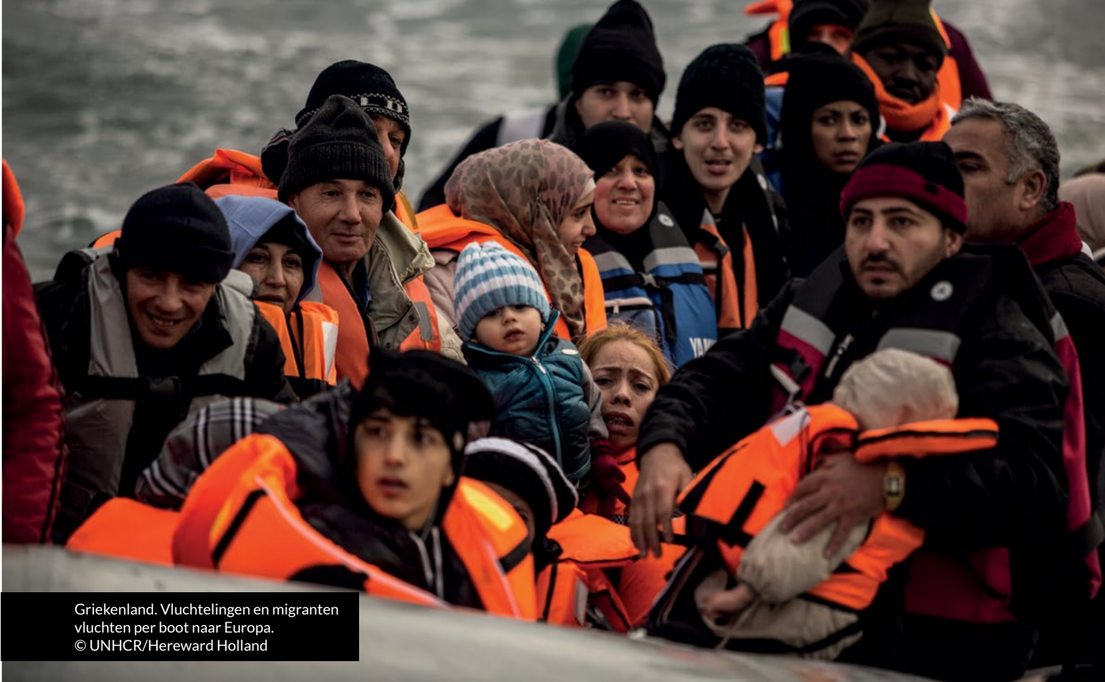
Griekenland. Vluchtelingen en migranten vluchten per boot naar Europa.

“ Het door elkaar halen van de termen vluchteling en migrant heeft aanzienlijke consequenties voor het welzijn en de veiligheid van vluchtelingen. Daarnaast komt het de publieke steun voor vluchtelingen niet ten goede. ”