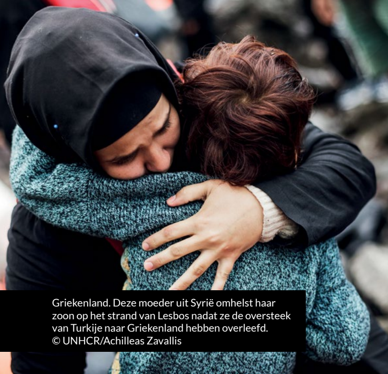
Griekenland. Deze moeder uit Syrië omhelt haar zoon op het strand van Lesbos nadat ze de oversteek van Turkije naar Griekenland hebben overleefd.