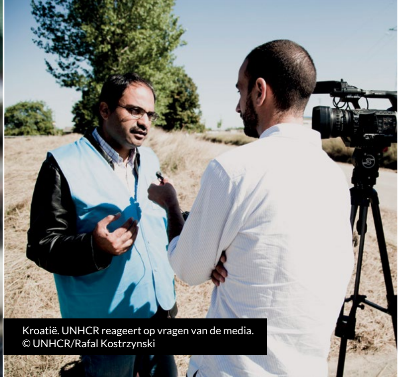
Kroatië. UNHCR reageert op vragen van de media.