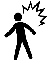
Slachtoffers van geweld/marteling