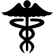
Urgente medische zorg

Vluchtelingen komen in aanmerking voor hervestiging als ze in één of meerdere kwetsbare categorieën vallen, bijvoorbeeld: