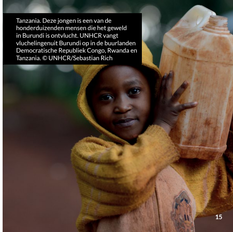
Tanzania. Deze jongen is een van de honderduizenden mensen die het geweld in Burundi is ontvlucht. UNHCR vangt vluchtelingen uit Burundi op in de buurlanden Democratische Republiek Congo, Rwanda en Tanzania.