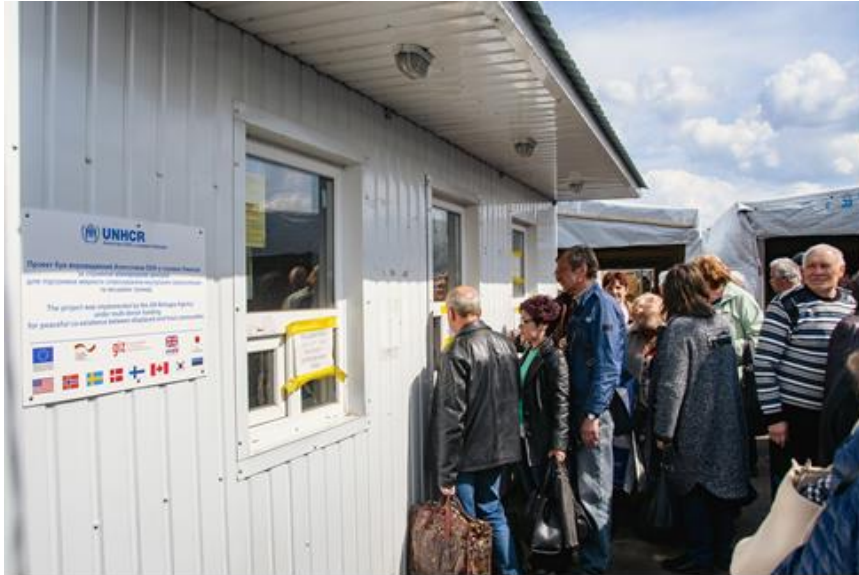
Допомогу, яку УВКБ ООН та його донори надають для КПВВ, видно на всіх блокпостах, наприклад на КПВВ «Майорськ». На цьому фото видно кабінки Державної прикордонної служби, а також укриття від сонця в зоні очікування, надані УВКБ ООН.