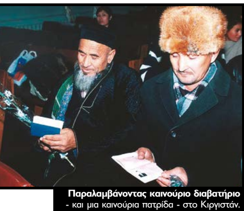
Παραλαμβάνοντας καινούριο διαβατήριο - και μια καινούρια πατρίδα - στο Κιργιστάν.

Η Ύπατη Αρμοστεία έχει υιοθετήσει μια Ατζέντα για τη Διεθνή Προστασία, δηλαδή μια σειρά από κατευθυντήριες οδηγίες που θα μπορούν να χρησιμοποιήσουν οι κυβερνήσεις και οι ανθρωπιστικές οργανώσεις για να ενδυναμώσουν την προστασία των προσφύγων παγκοσμίως. Επίσης, έχει αναλάβει διάφορες συγκεκριμένες πρωτοβουλίες που περιλαμβάνουν ένα διευρυμένο πρόγραμμα μετεγκατάστασης προσφύγων, επανένταξη των προσφύγων στις τοπικές κοινωνίες και καλύτερη κατανομή του βάρους αντιμετώπισης των αναγκών των προσφύγων ανάμεσα στις χώρες υποδοχής. Επίσης αναζητά προγράμματα που να γεφυρώνουν το κενό ανάμεσα στην επείγουσα βοήθεια προς τους πρόσφυγες και την μακροπρόθεσμη ανάπτυξη των πολιτών και των κατεστραμμένων κοινωνιών.