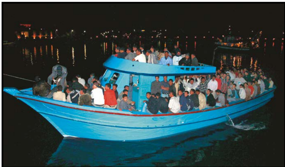
Βάρκα που ανακαλύφθηκε κοντά στο ιταλικό νησί της Λαμπεντούσα.

Σε τέτοιες περιπτώσεις, οι αξιωματούχοι της Ύπατης Αρμοστείας προσπαθούν να διεξάγουν συνέντευξη στο πλοίο, και εφόσον αποδειχθεί ότι ο αιτών άσυλο θεωρείται πρόσφυγας, τότε παρέχουν βοήθεια στην εξεύρεση μόνιμης λύσης που είναι συνήθως η μετεγκατάσταση σε τρίτη χώρα.