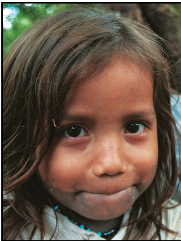
Κολομβιανή οικογένεια στον Παναμά.

Η προσωρινή προστασία δεν θα πρέπει να παρατείνεται επί αόριστο, και μετά από ένα εύλογο διάστημα θα πρέπει οι ενδιαφερόμενοι να μπορούν να ζητήσουν άσυλο. Αν αυτό απορριφθεί, θα πρέπει να μπορούν να παραμείνουν στη χώρα ασύλου μέχρις ότου είναι ασφαλές να επιστρέψουν στη χώρα τους.