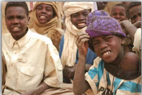
Ασυνόδευτα παιδιά περιμένουν και ελπίζουν σε προσφυγικό καταυλισμό στο Τσαντ.

του Ερυθρού Σταυρού και την οργάνωση «Σώστε τα παιδιά» για να διασφαλίσουν ότι τα ασυνόδευτα παιδιά αναγνωρίζονται και καταγράφονται, και πως οι οικογένειές τους έχουν βρεθεί. Στην κρίση της Ρουάντας στα μέσα της δεκαετίας του 1990, υπολογίζεται ότι 67.000 παιδιά ξαναβρήκαν τις οικογένειές τους.