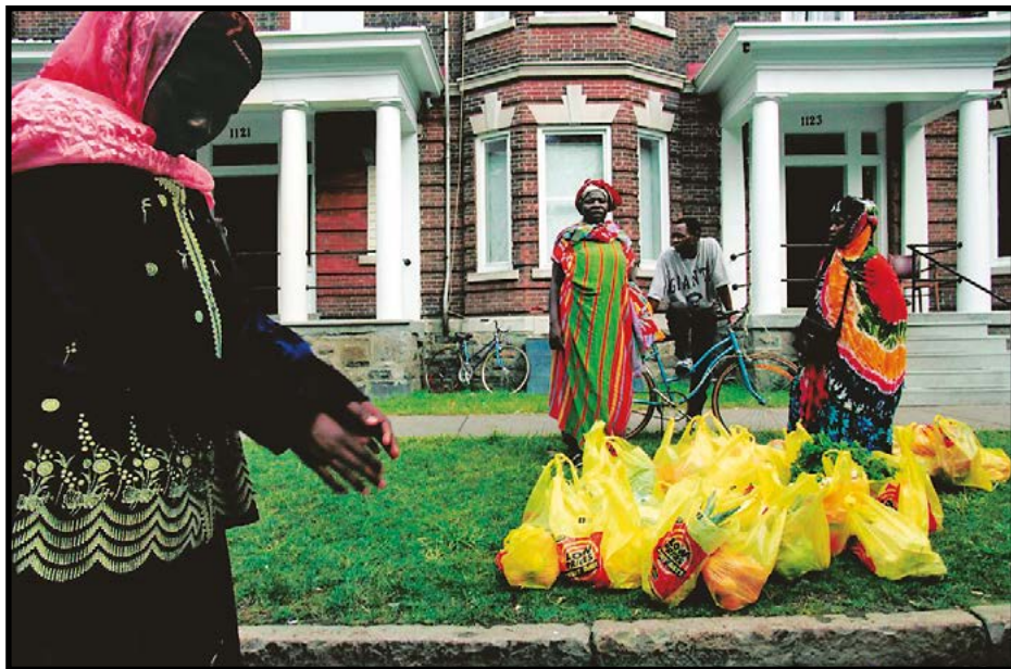
Σομαλοί Μπαντού στο ξεκίνημα της καινούριας ζωής τους στις ΗΠΑ.