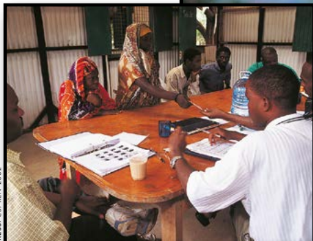
Στην Κένυα Σομαλοί Μπαντού περνούν από ατομική εξέταση ασύλου.