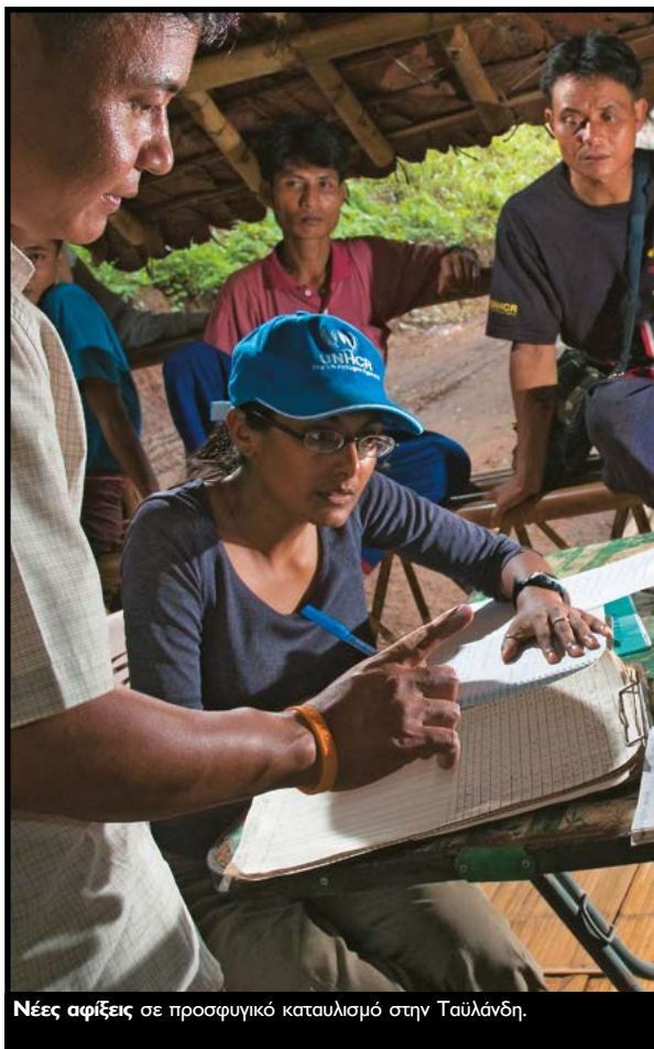
Νέες αφίξεις σε προσφυγικό καταυλισμό στην Ταϊλάνδη.

Ο ι πρόσφυγες πρέπει να σεβονται τους νόμους και τους κανονισμούς της χώρας ασύλου.