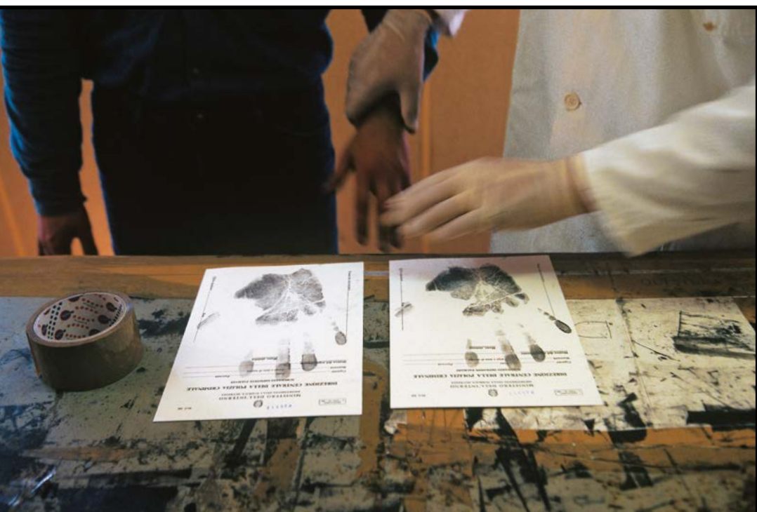
Λήψη δακτυλικών αποτυπωμάτων από αιτούντες άσυλο στην Ιταλία.

δύσκολο έργο. Η Εκτελεστική Επιτροπή της Ύπατης Αρμοστείας του ΟΗΕ για τους Πρόσφυγες (της οποίας τα μέλη ανέρχονται σε 87) καθορίζει μη-δεσμευτικές βασικές αρχές, ενώ το «Εγχειρίδιο για τις Διαδικασίες και τα Κριτήρια Καθορισμού του Καθεστώτος των Προσφύγων» αποτελεί έγκυρη ερμηνεία της Σύμβασης του 1951. Σε ορισμένες χώρες που δεν έχουν υπογράψει τη Σύμβαση του 1951, και εφόσον κάτι τέτοιο της ζητηθεί, η Ύπατη Αρμοστεία μπορεί η ίδια να αναλάβει τη διαδικασία καθορισμού του καθεστώτος του πρόσφυγα και να προσφέρει την προστασία και βοήθειά της.