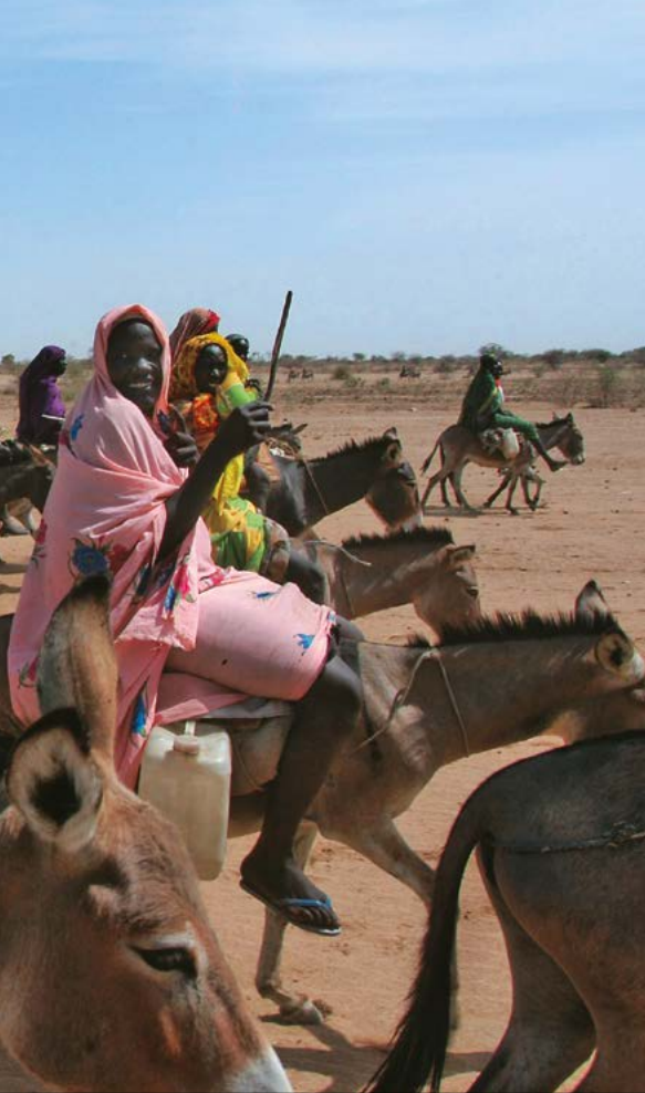
Εκτοπισμένες Σουδανέζ γυναίκες στο Νταρφούρ.