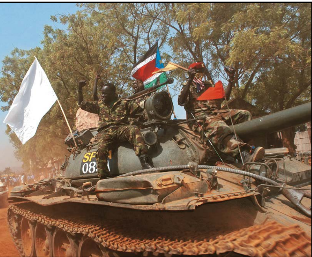
Στρατιώτες στην Τζούμπα, Νότιο Σουδάν.