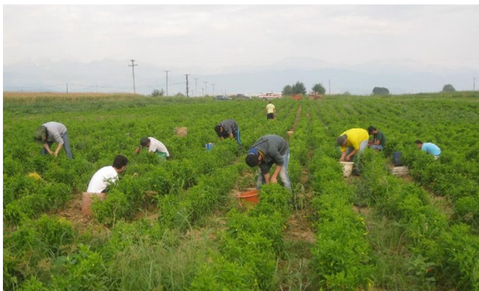
Οι πρόσφυγες που εργάζονται στο μάζεμα πιπεριάς στην Καρδίτσα, για μια νέα ζωή!

Με δεδομένη την αυξημένη ανάγκη για εργατικό δυναμικό στον αγροτικό τομέα, το Δίκτυο Πόλεων για την Ένταξη έχει βάλει σε εφαρμογή μια πιλοτική δράση διασύνδεσης μεταξύ αστικών κέντρων και των αγροτικών περιοχών, με στόχο την προώθηση της εργασιακής ένταξης του προσφυγικού πληθυσμού.