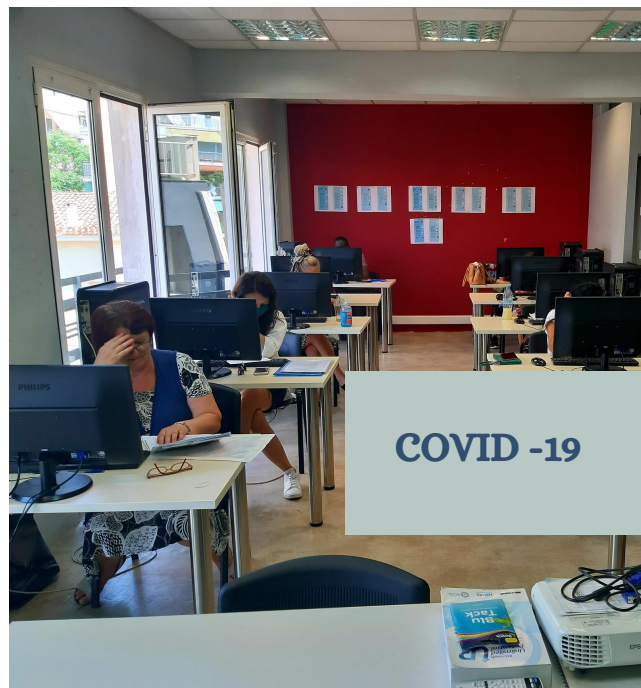
Μαθήματα Υπολογιστών στο Κέντρο Ένταξης Μεταναστών του Δήμου Αθηναίων

Το βιβλίο συνταγών και ιστοριών σας προσκαλεί μέσα από τις σελίδες του να γνωρίσετε γυναίκες δραστήριες και δημιουργικές που ζουν στην Αθήνα. Ελληνίδες, μετανάστριες και προσφύγισες που μαγείρεψαν με πολλή αγάπη και έδωσαν την ευκαιρία στους κατοίκους της πόλης να γνωρίσουν γεύσεις τόσο από την Ελλάδα όσο και από όλο τον κόσμο. Το Bahar αποτελεί μια πρωτοβουλία του ACCMR, οι τρεις δράσεις του οποίου πραγματοποιήθηκαν με τη στήριξη της διοργάνωσης "Αθήνα - Παγκόσμια Πρωτεύουσα του Βιβλίου 2018" του δήμου Αθηναίων .