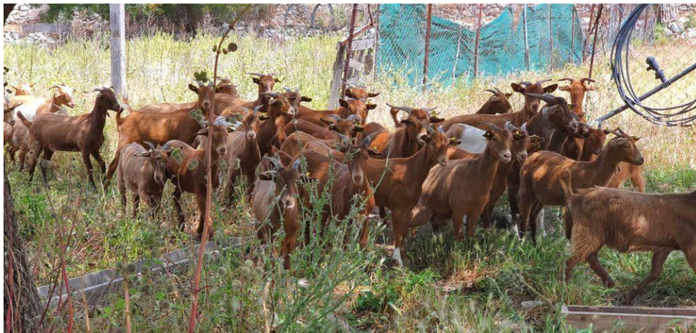
Πενήντα νέα ζώα έφτασαν στο νησί στις 15 Μαΐου, που αποτελούν επένδυση για την επόμενη γαλακτοκομική περίοδο.