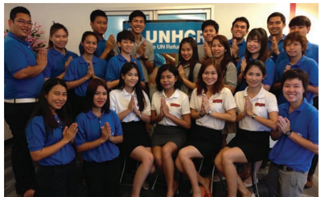
ทีมพนักงานระดมทุนของ UNHCR ผู้ที่ทำงานอย่างไม่ย่อท้อเพื่อผู้ลี้ภัยให้มีชีวิตใหม่ Teams of fundraisers representing UNHCR work diligently to rebuild refugees' lives.