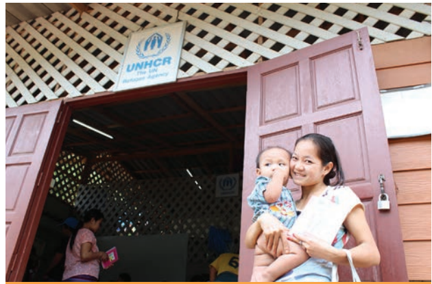
หญิงผู้ลี้ภัยที่ลูกน้อยของเธอได้รับใบสูติบัตรด้วยการสนับสนุนจาก UNHCR A refugee mother and her son in Tham Hin refugee camp happily received a birth certificate with support from UNHCR.

Our teams of passionate and dedicated fundraisers are working hard every day to find new UNHCR supporters, just like you. Through their work, and the generosity of the people they talk to, UNHCR is able to protect and provide vital assistance to 120,000 refugees from Myanmar who were forced to flee their homes and have no choice but to live in the nine border camps in Thailand. The more supporters that join UNHCR by signing up with our fundraisers, the more we can do to provide refugees with safety, protection and a sustainable future. If you see the fundraising team working in Bangkok or elsewhere in Thailand please give them your encouragement. They would love to talk to you!