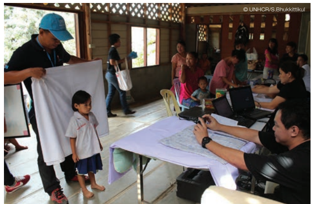
เจ้าหน้าที่ UNHCR และกระทรวงมหาดไทยกำลังเตรียมใบสูติบัตรย้อนหลังให้กับเด็ก ๆ ในค่ายผู้ลี้ภัยท่าหิน UNHCR and Ministry of Interior officers processing the backlog of birth certificates to refugee children in Tham Hin refugee camp.