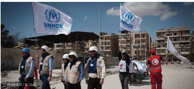
ท่ามกลางการทำลายล้างของสงคราม ๑๕ UNHCR มุ่งตรงไปข้างหน้าเพื่อส่งมอบความช่วยเหลือด้านมนุษยธรรมที่จำเป็นอย่างเร่งด่วนให้ชาวซีเรียในช่วงการหยุดยิงในเมืองเอเล็ปโป Amid the destruction of war, the UNHCR flag is carried forward during a ceasefire in Aleppo that allowed the delivery of desperately needed humanitarian aid.

It is estimated that some 6.5 million of Syria's 22 million people have been displaced inside the country, while another 2.6 million are now refugees, mainly in neighbouring countries. The humanitarian situation continues to deteriorate. Please donate at www.unhcr.or.th .