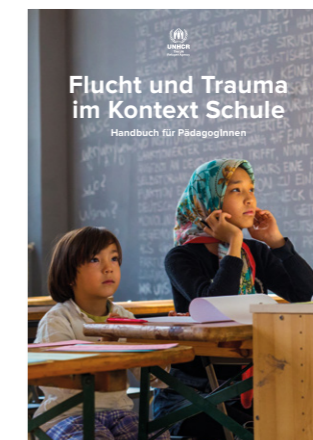
Flucht und Trauma im Kontext Schule. Handbuch für PädagogInnen.