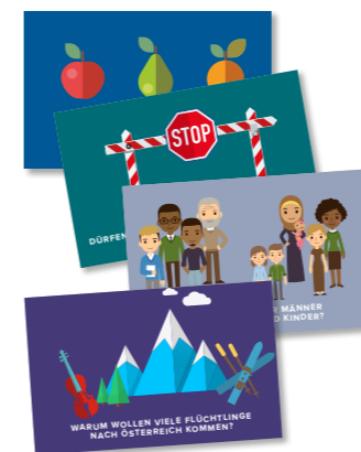
Postkarten zu Flucht und Asyl.