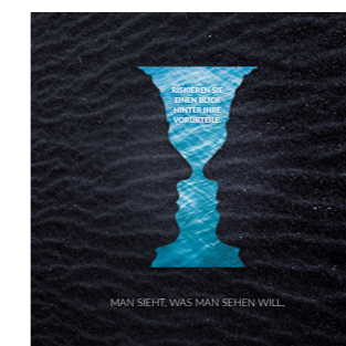
Riskieren Sie einen Blick hinter Ihre Vorurteile.