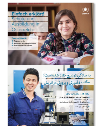
Einfach erklärt! Schule und Ausbildung in Österreich.