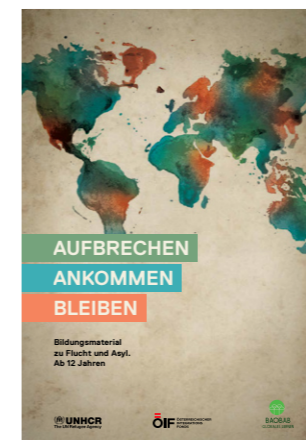
Aufbrechen – Ankommen – Bleiben. Bildungsmaterial ab 12 Jahren.

Weiterführende Informations- und Bildungsmaterialien zu den Themen Flucht und Asyl können unter www.unhcr.at/publikationen kostenlos bestellt und herunter geladen werden.