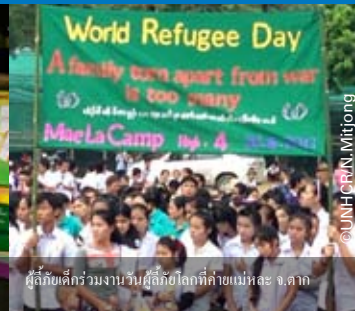
ผู้ลี้ภัยเด็กร่วมงานวันผู้ลี้ภัยโลกที่ค่ายแม่ทะละ จ.ตาก