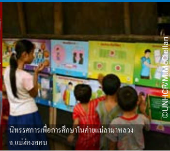
นิทรรศการเพื่อการศึกษาในค่ายแม่ลานหลวง จ.แม่ฮ่องสอน