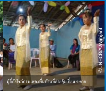
ผู้ลี้ภัยเข้าร่วมการแสดงพื้นบ้านที่ค่ายผู้ลี้ภัย จ.ตาก