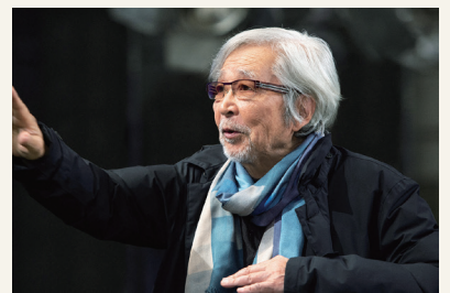
山田 洋次 監督

演じるのは23年ぶりにスクリーンに戻ってきた後藤久美子さん。『男はつらいよ お帰り 寅さん』のイズミ・ブルーナUNHCR上級渉外官はどのように生まれたのか。その裏話を少しご紹介します。