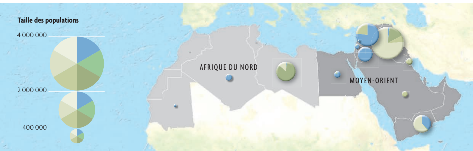
Taille des populations

Au Liban, le HCR est venu en aide à plus de 11 000 réfugiés et demandeurs d'asile en leur offrant une assistance juridique, ainsi que des services médicaux et éducatifs. En Jordanie,