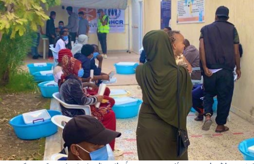
لاجئون وطالبو لجوء ممن أفرج عنهم مؤخراً يتلقون المساعدات في مركز تنمية المجتمع بطرابلس

نتقدم بشكر خاص للمانحين: كندا | الدنمارك | الاتحاد الأوروبي | فنلندا | فرنسا | ألمانيا | إيطاليا | اليابان | النرويج | السويد | سويسرا | هولندا | المملكة المتحدة | الولايات المتحدة الأمريكية | جهات مانحة خاصة