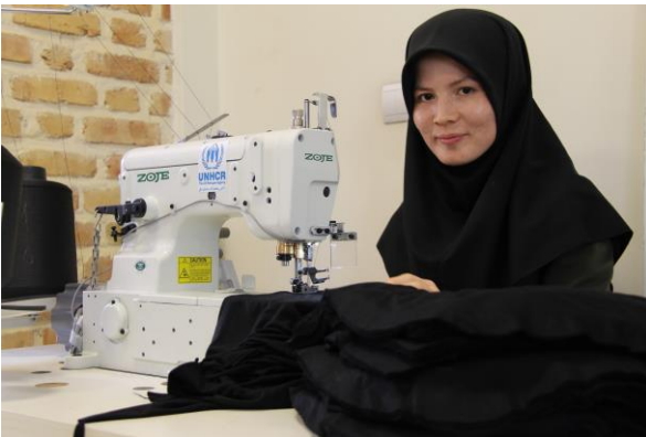
دولت ایران، کمیساریا و شرکای غیردولتی به پناهندگان کارآفرین افغانستانی در راه اندازی مشاغل کمک می‌کنند.

در طی سال‌های اخیر تغییرات مثبتی نسبت به افزایش فرصت‌های مختلف معیشتی پناهندگان به وجود آمده است. این تغییرات حاکی از تصدیق نیاز به توانمندسازی پناهندگان برای داشتن درآمدی مناسب است. فراهم کردن امکان بهره‌بردن پناهندگان از فرصت‌های معیشتی آنها را خود متکی و خودکفا کرده فلذا آنها قادر خواهند بود نیازهای اساسی خانواده‌های خود را تامین کرده و وابستگی کمتری به کمک‌های بشردوستانه داشته باشند. پناهندگانی که قادر به افزایش مهارت‌ها و ظرفیت‌های خود هستند و کسب درآمد می‌کنند، در مقایسه با پناهندگانی که این امکان را نداشته‌اند برای برگشت به وطن خود آمادگی بیشتری دارند.