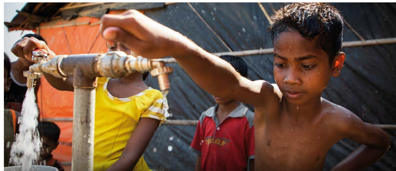
Dans le camp de réfugiés de Kutupalong (Bangladesh), un jeune réfugié rohingya collecte de l'eau provenant d'une station de pompage et de désinfection fonctionnant à l'énergie solaire.