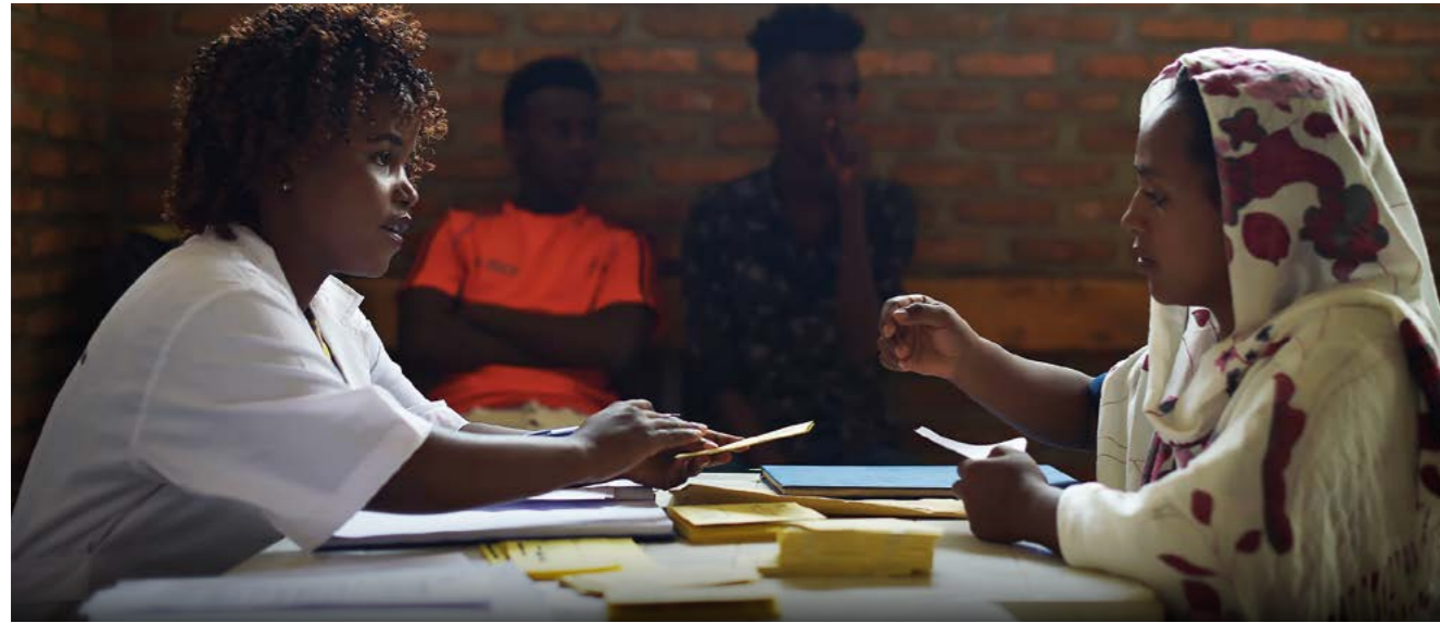
Au centre de transit d'urgence de Gashora, au Rwanda, un membre de l'équipe médicale prépare un livret de vaccination pour une femme qui doit passer une visite médicale.