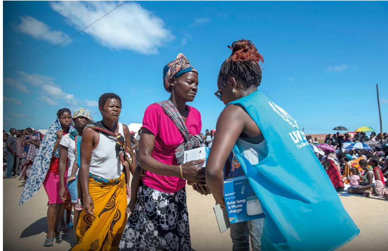
Le personnel du HCR distribue des lampes solaires en partenariat avec l'ONG Électriciens sans Frontières dans le camp de Picoco, à Beira (Mozambique).