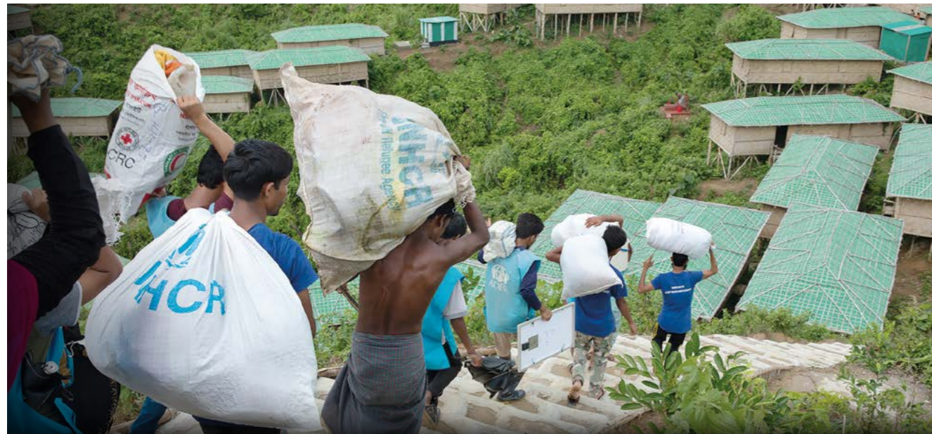
Après trois jours de pluie incessante, qui ont causé des inondations, des glissements de terrain et des dégâts, des familles sont transférées dans de nouveaux abris sur le site Chakmarkul, à Cox's Bazar. Des articles d'urgence prépositionnés ont été distribués pour faciliter la reconstruction, la réparation et la consolidation des abris endommagés.