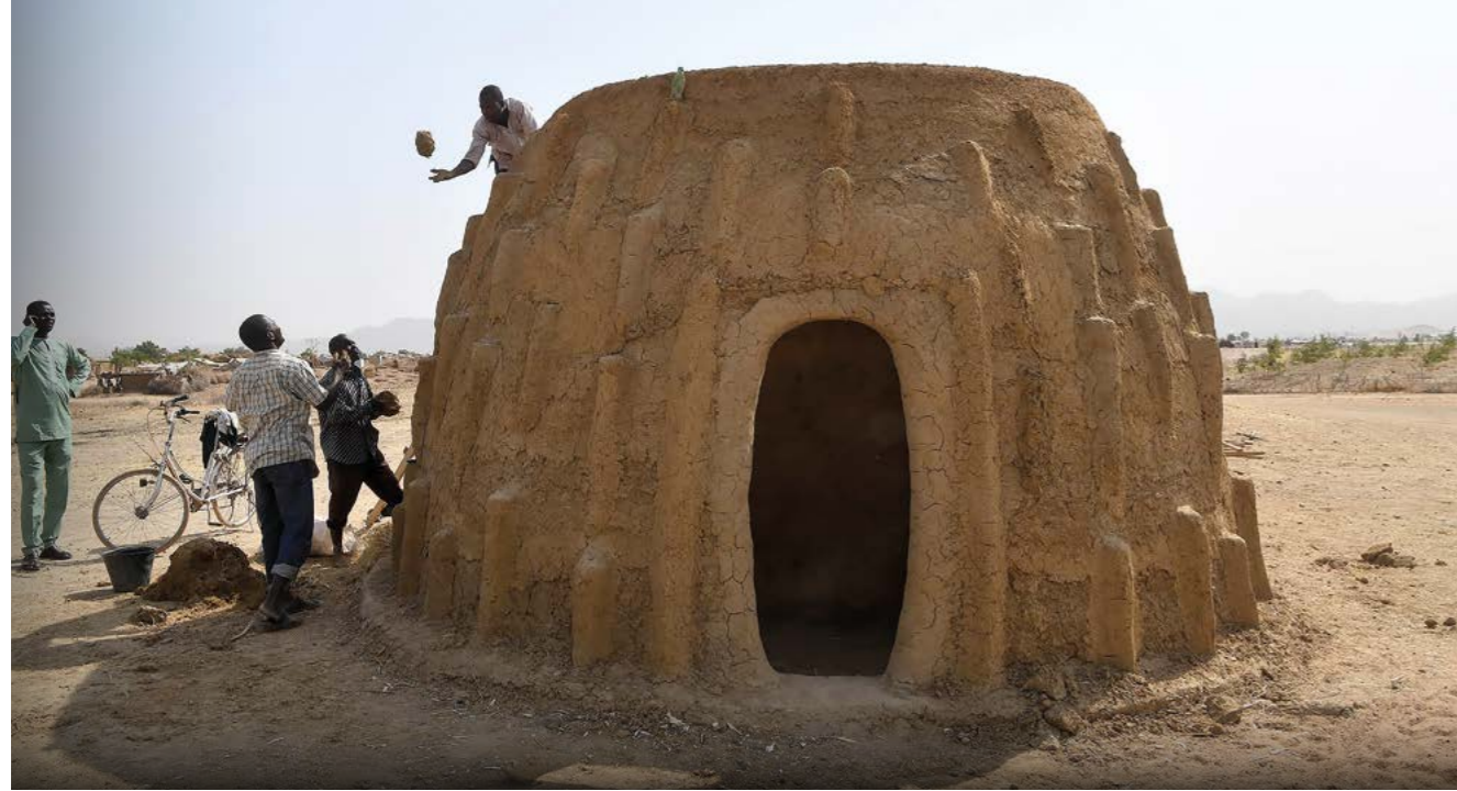
Un réfugié nigérian travaille à la construction d'une maison traditionnelle en terre séchée dans le camp de Minawao, au Cameroun. La maison est construite à titre d'essai et si l'expérience est concluante, d'autres maisons de ce type pourraient être construites afin de fournir des abris sans utiliser de bois.