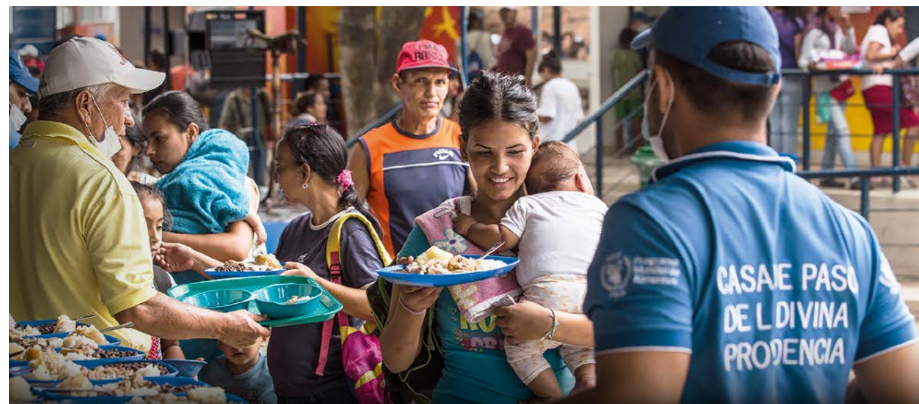
Des Vénézuéliens viennent prendre un repas dans une cantine communautaire gérée par le diocèse de l'église catholique à Cucuta (Colombie). La cantine sert 8 000 repas par jour.