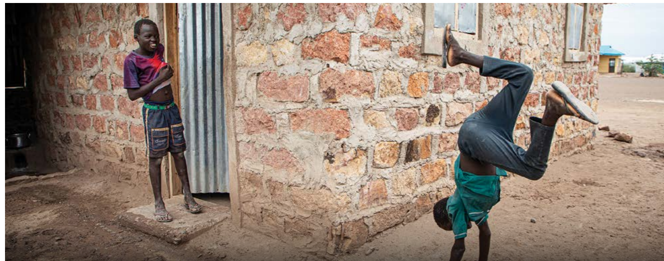
Un réfugié sud-soudanais joue devant sa nouvelle maison, construite dans le cadre d'un projet d'aide en espèces dans le site d'installation de Kalobeyei (Kenya).