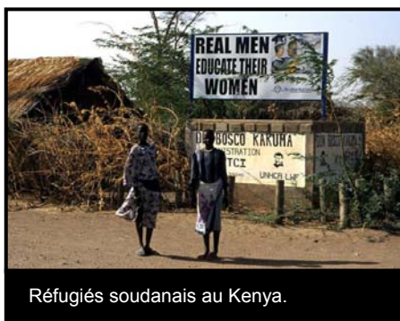
Réfugiés soudanais au Kenya.

Il convient également de mentionner la persécution sexiste. Par exemple, des femmes obligées de fuir pour des raisons politiques, ethniques ou religieuses, ou à cause de codes sociaux stricts mis en place par l'Etat ou des acteurs privés, ont le droit d'être protégées contre la persécution, au même titre que des victimes de violence sexuelle ou de viol. Un certain nombre de pays disposent de directives exhaustives en matière de persécution sexiste.