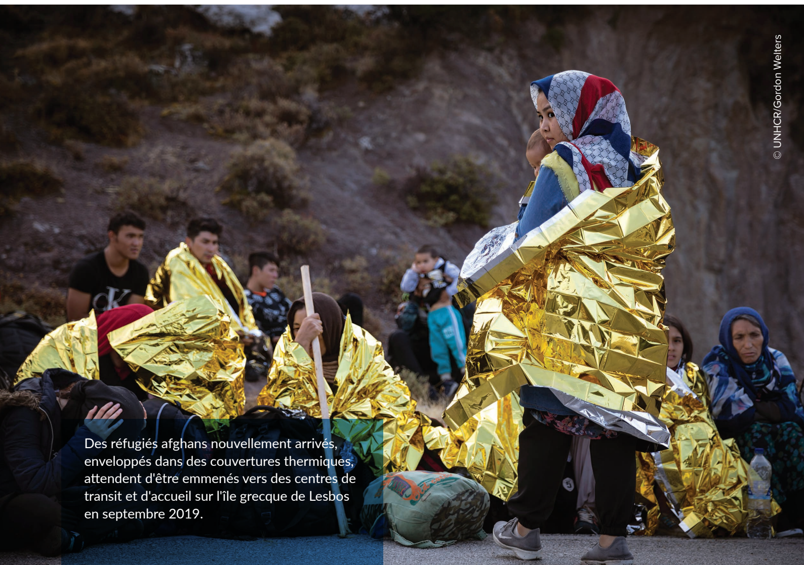
Des réfugiés afghans nouvellement arrivés, enveloppés dans des couvertures thermiques, attendent d'être emmenés vers des centres de transit et d'accueil sur l'île grecque de Lesbos en septembre 2019.

Le 2 septembre, plus de 1400 personnes du centre d'accueil de Moria sur l'île de Lesbos ont été transférées vers l'installation de Nea Kavala au nord de la Grèce. Le HCR continue d'appuyer le transport des demandeurs d'asile depuis les îles vers la Grèce continentale. Toutefois, la capacité des