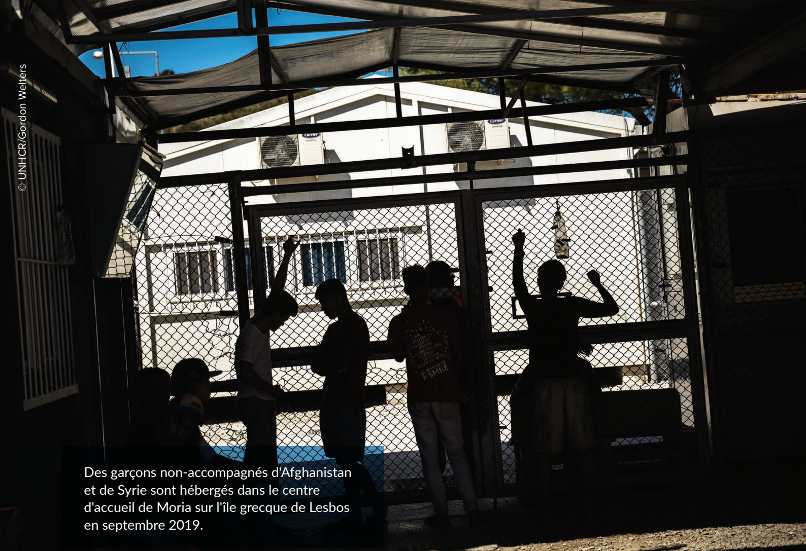
Des garçons non-accompagnés d'Afghanistan et de Syrie sont hébergés dans le centre d'accueil de Moria sur l'île grecque de Lesbos en septembre 2019.

recensées (4600), mais ce chiffre a depuis reculé suite à un accroissement du soutien 17 et de la coopération des autorités espagnoles envers les autorités marocaines en matière de recherche et de sauvetage en mer. Les arrivées par voie terrestre dans les enclaves espagnoles de Ceuta et Melilla ont diminué de 11% par rapport à la même période l'année dernière, bien que des tentatives sporadiques de franchir les grilles continuent d'être observées. La majorité des arrivées à ce jour avaient pour origine le Maroc (29%), la Guinée (14%), le Mali (13%), la Côte d'Ivoire (11%) et l'Algérie (8%).