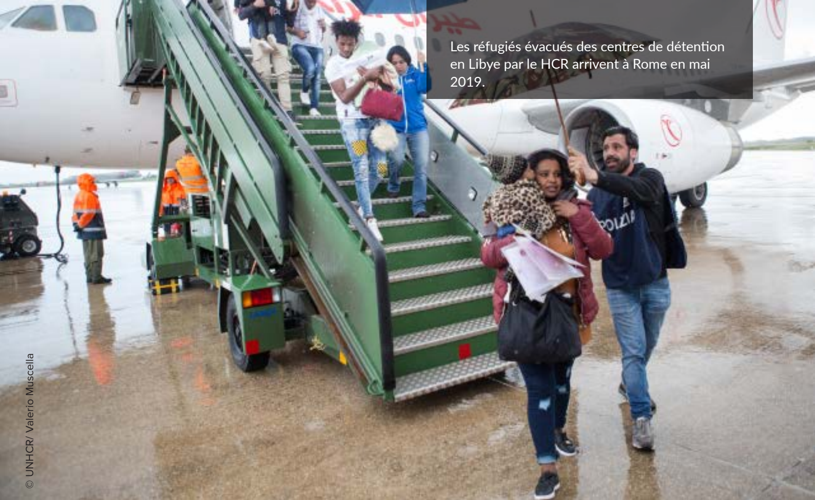
Les réfugiés évacués des centres de détention en Libye par le HCR arrivent à Rome en mai 2019.