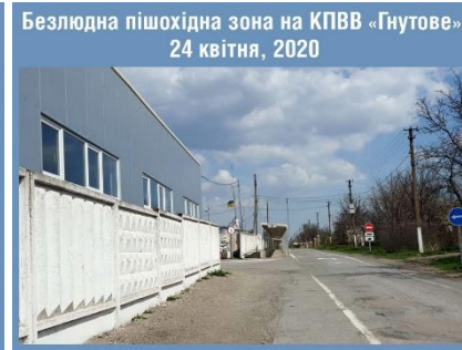
Безлюдна пішохідна зона на КПВВ «Гнутове» 24 квітня, 2020