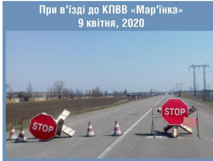
При в'їзді до КПВВ «Мар'їнка» 9 квітня, 2020

На КПВВ «Новотроїцьке» не вдалося перетнути лінію розмежування чоловіку, якій вирушав додому на НКУУТ після роботи за кордоном на похорон дружини попри наявність свідоцтво про смерть.