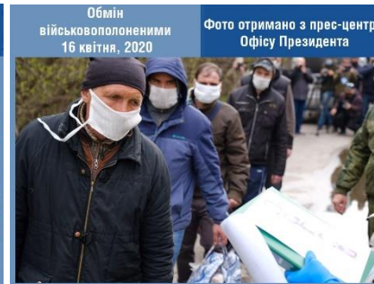
Обмін військовополоненими 16 квітня, 2020