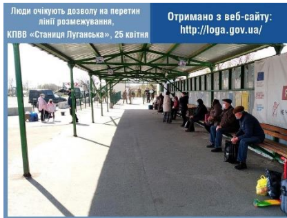
Люди очікують дозволу на перетин лінії розмежування, КПВВ «Станиця Луганська», 25 квітня