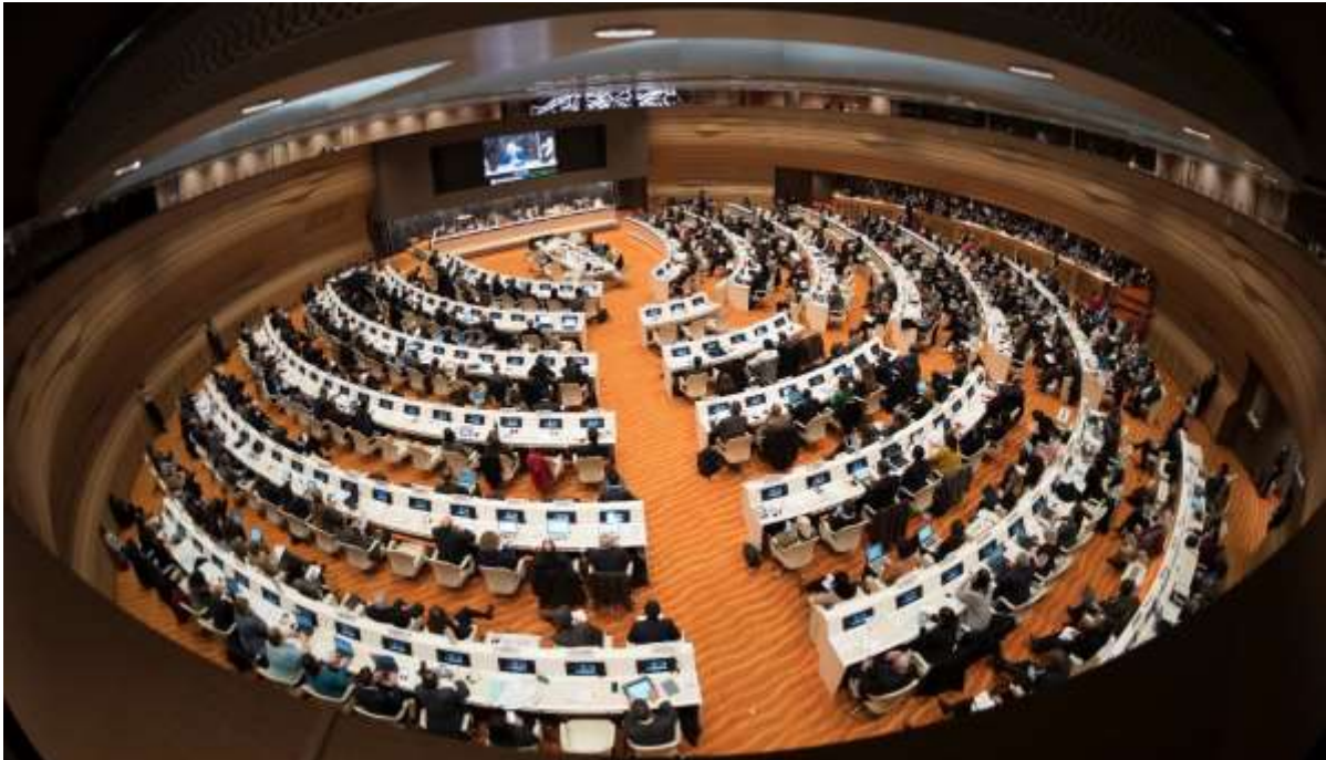
The 2017 High Commissioner's Dialogue on Protection Challenges was used to take stock of progress made in the development of the global compact on refugees, ahead of the release of the 'zero draft' in January 2018.