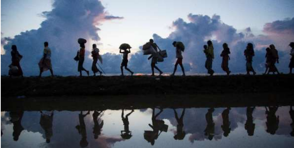
Біженці Рохінджа входять у Бангладеш. Жовтень 2017 р.