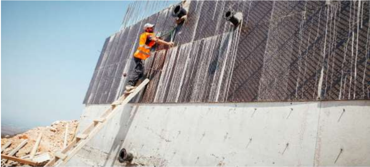
A new water reservoir for Syrian refugees and host communities is under construction in Machha, Lebanon. The project, which is supported by the European Union, has provided livelihood opportunities for close to 200 Lebanese and Syrian workers.