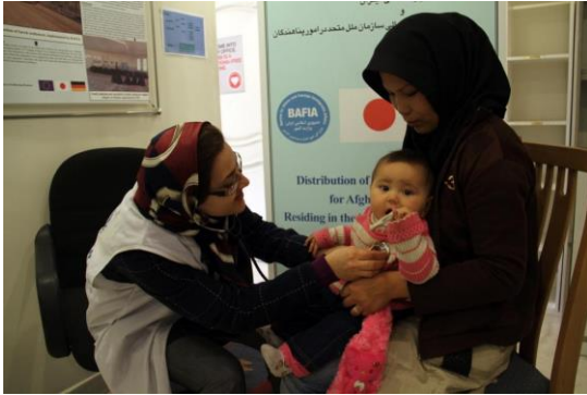
پناهندگانی که از پوشش بیمه سلامت برخوردارند دسترسی بهتری به خدمات سلامت دارند. / کمیساریا ایران.

طرح بیمه درمانی سلامت: پس از امضای تفاهم‌نامه سه جانبه کمیساریا، اداره کل امور اتباع و مهاجرین خارجی و سازمان بیمه سلامت ایران و با همکاری تنگتنگ وزارت بهداشت، آموزش و درمان پزشکی، تمامی پناهندگان دارای کارت آمایش برای پنجمین سال متوالی از سال ۲۰۱۵ میلادی تا کنون می‌توانند در طرح بیمه سلامت ثبت نام کنند و مانند شهروندان ایرانی از مزایای بسته بیمه درمانی بهره‌مند شوند؛ که پوشش هزینه‌های خدمات بستری و پاراکلینیکی (مانند دارو، ویزیت پزشک، عکس برداری و غیره) را شامل می‌شود. در بازه زمانی سال ۲۰۱۹-۲۰۲۰ میلادی کمیساریا ۱۰۰٪ هزینه حق بیمه ۹۲,۰۰۰ پناهنده آسیب‌پذیر از جمله پناهندگانی که از بیماری‌های خاص ۷ رنج می‌برند و خانواده‌های آنها را پوشش می‌دهد. این در حالیست که سایر پناهندگان می‌توانند با پرداخت هزینه حق بیمه در چهار بازه زمانی مشخص در طول سال در طرح بیمه سلامت ثبت‌نام کنند. سومین بازه زمانی ثبت‌نام از ۱ مهرماه تا ۲۰ مهر ماه سال ۱۳۹۸ می‌باشد. این پناهندگان می‌توانند از مزایای بیمه سلامت برای ۱۲ ماه از زمان ثبت‌نامشان بهره‌مند شوند. این طرح بیمه علاوه بر بهبود وضعیت بهداشتی برای پناهندگان شامل مزیت‌های حمایتی اجتماعی است؛ و حمایت بالقوه ایست برای پایین آوردن ریسک هزینه‌های بسیار بالای درمانی شخصی و مکانیسم‌های مقابله‌ای منفی ناشی از آسیب‌پذیری اقتصادی پناهندگان؛ به خصوص در رابطه با عمل جراحی و بستری الزامی.