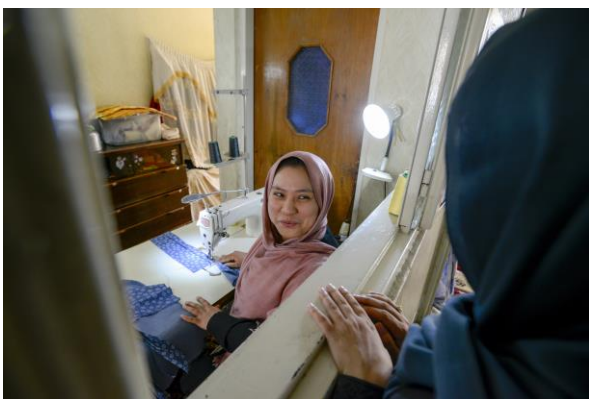
دولت ایران و کمیساریایا به پناهندگان و کارآفرینان افغان در راه‌اندازی مشاغل کمک می‌کنند. / کمیساریا ایران.

در طی سال‌های اخیر تغییرات مثبتی نسبت به افزایش فرصت‌های مختلف معیشتی پناهندگان به وجود آمده است. این تغییرات حاکی از تصدیق نیاز به توانمندسازی پناهندگان برای داشتن درآمدی مناسب است. فراهم کردن امکان بهره‌بردن پناهندگان از فرصت‌های معیشتی آنها را خود متکی و خودکفا کرده فلذا آنها قادر خواهند بود نیازهای اساسی خانواده‌های خود را تامین کرده و وابستگی کمتری به کمک‌های بشردوستانه داشته باشند. پناهندگانی که قادر به افزایش مهارت‌ها و ظرفیت‌های خود هستند و کسب درآمد می‌کنند، در مقایسه با پناهندگانی که این امکان را نداشته‌اند برای برگشت به وطن خود آمادگی بیشتری دارند.