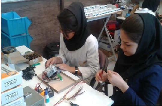
پناهندگان جوان افغانستانی از طریق دوره‌های آموزشی فنی و حرفه‌ای در ایران، مهارت‌های قابل عرضه در بازار و مورد تقاضا را کسب می‌کنند.

است. افرادی که در این سرشماری شرکت کردند ساکن ایران بوده ولی فاقد کارت آمایش معتبر، پاسپورت افغانستانی با ویزای ایران هستند. نوع مدارکی که قرار است برای شهروندان افغانستانی که در طرح‌های سرشماری شرکت کرده‌اند صادر شود در دست مذاکره است. در نوامبر ۲۰۱۸ میلادی، دولت طرح سرشماری جدیدی اینبار از اتباع خارجی که به صورت رسمی و یا غیررسمی در ایران مشغول به کار هستند و کارفرمایان آنها را آغاز کرده است. کمیساریا برای پیگیری این مسئله به طور مداوم با طرفین ذیربط در ارتباط است.