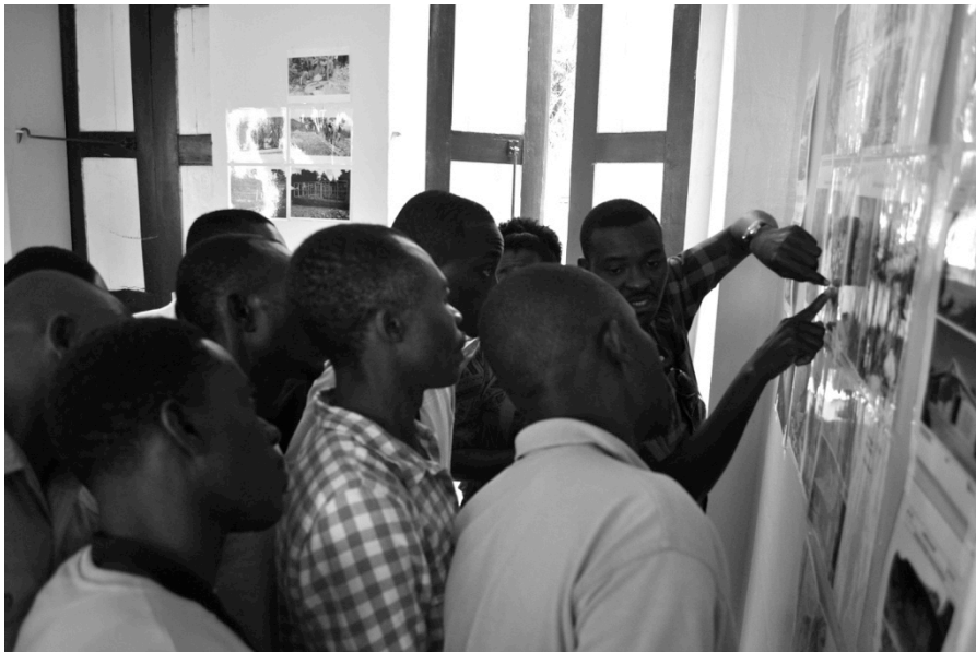
Session de sensibilisation aux Techniques de Construction Locales Améliorées, à Jérémie le 21 Février 2017.