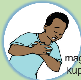
magumu ya kupumuwa