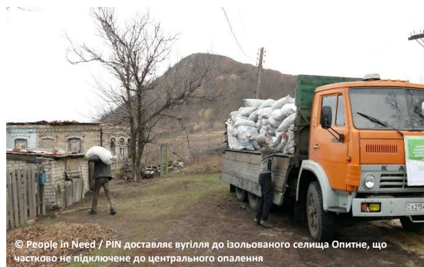
© People in Need / PIN доставляє вугілля до ізольованого селища Опитне, що частково не підключене до центрального опалення

Вартість електроенергії для ВПО, які проживають в дачних кооперативах, більш ніж удвічі вища від стандартного тарифу для населення. 13 Ці кооперативи не включені до переліку «місць компактного проживання», наведений у Законі України «Про забезпечення прав і свобод внутрішньо переміщених осіб» , що унеможливує оплату за електроенергію ВПО за тарифом для населення та призводить до необґрунтованого підвищення витрат.