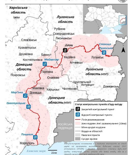
Україна: Зона вздовж лінії розмежування