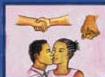
Beijo no rosto; Aperto de mão / abraço