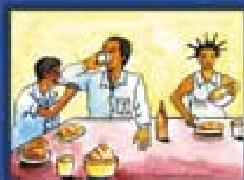
Talheres / copo