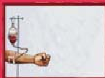
Transusão de sangue contaminado