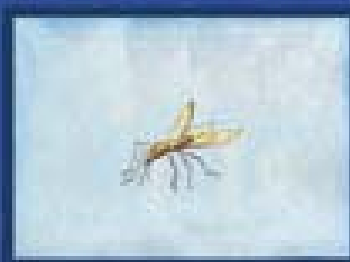
Picada de insecto