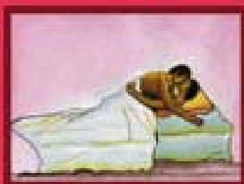
Sexo sem protecção