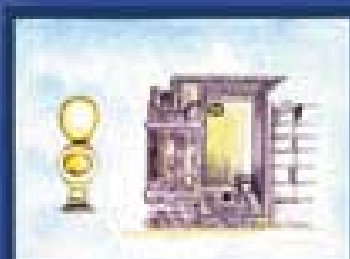
Casa de banho ou Latrina