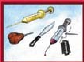
Uso de seringa não esterilizada; Instrumentos que furam ou cortam não esterilizados