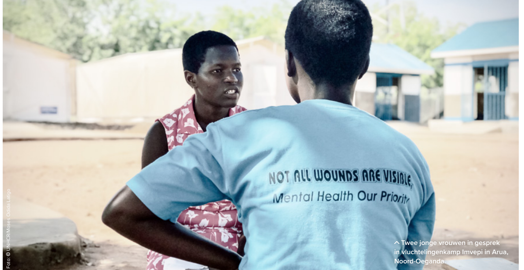
^ Twee jonge vrouwen in gesprek in vluchtelingenkamp Imvepi in Arua, Noord-Oeganda.

Karim wil dat er meer aandacht komt voor dit onderwerp. In oktober