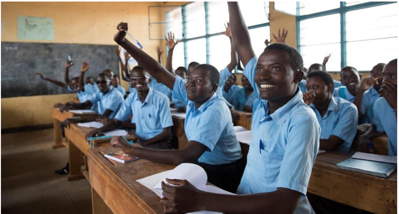
Беженцы из Бурунди и члены принявшего их местного сообщества учатся вместе в Paysannat School на востоке Руанды.