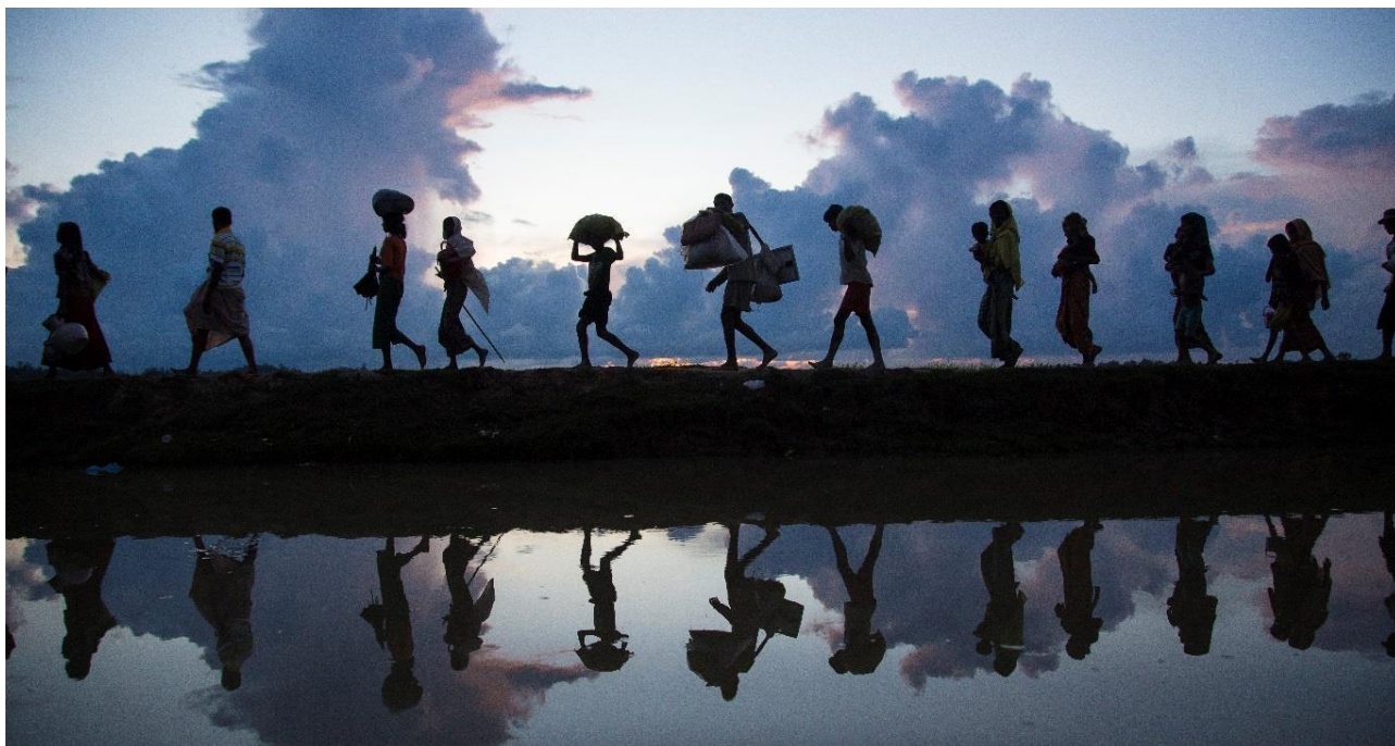
Беженцы рохинджа прибывают в Бангладеш в октябре 2017 года.