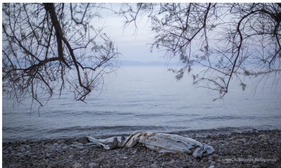
Τα απομεινάρια μιας φουσκωτής βάρκας που χρησιμοποιήθηκε από πρόσφυγες και μετανάστες για να περάσουν από την Τουρκία στην Ελλάδα.

Θεσσαλονίκη, Λέσβο, Αττική, Χίο, Σάμο, Κω, Έβρο, Ιωάννινα, Λέρο και Ρόδο