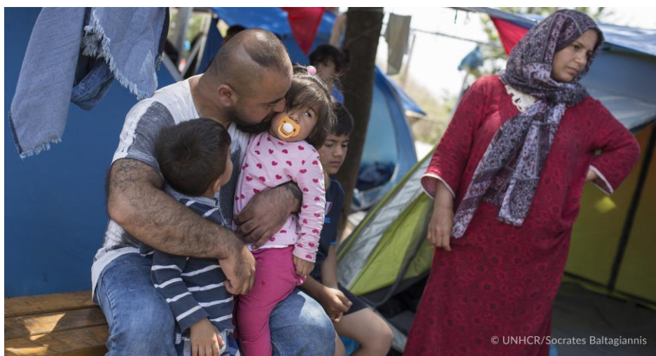
Μια Ιρακινή οικογένεια, που έφτασε στην Ελλάδα από τον ποταμό Έβρο, στον χώρο φιλοξενίας προσφύγων στα Διαβατά.