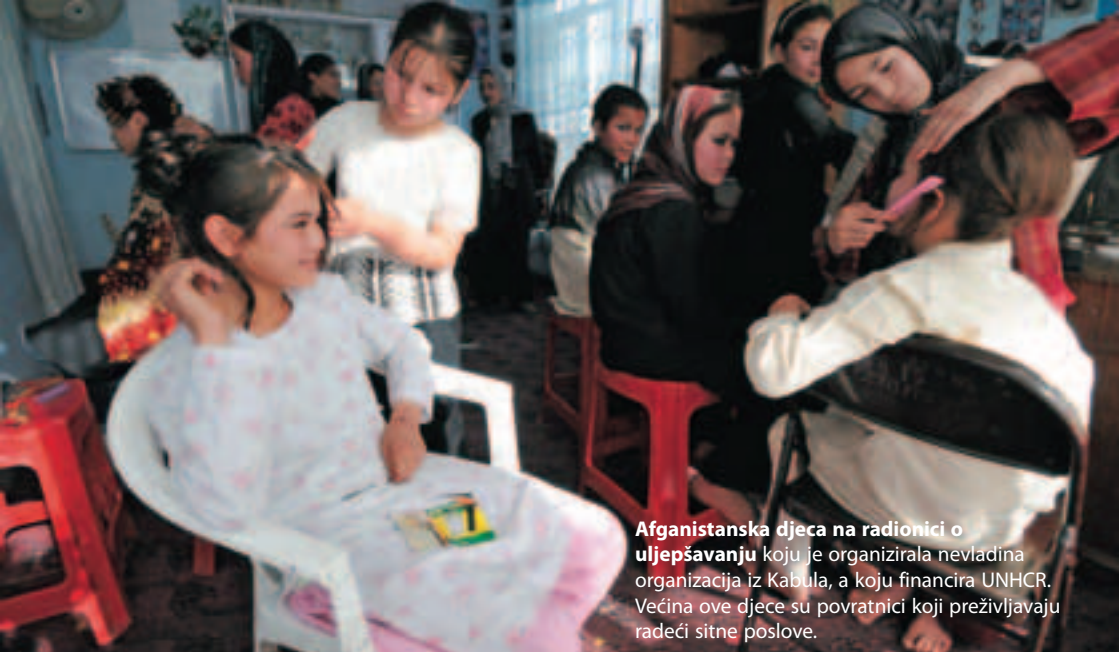
Afganistanska djeca na radionici o uljepšavanju koju je organizirala nevladina organizacija iz Kabula, a koju financira UNHCR. Većina ove djece su povratnici koji preživljavaju radeći sitne poslove.