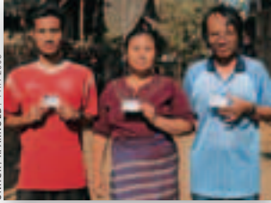
Izbjeglice iz Myanmara ponosno pokazuju svoje identifikacijske dokumente u kampu na Tajlandu.

Na vladama leži osnovna odgovornost za pružanje zaštite izbjeglicama na svome teritoriju i one tu zaštitu pružaju, često zajedno s nevladinim udrugama. Međutim, u mnogim zemljama i osoblje UNHCR-a također radi skupa s nevladinim udrugama i drugim partnerima kako u glavnim gradovima tako i u udaljenim pograničnim centrima. Zajednički nastoje promicati ili pružiti pravnu i fizičku zaštitu te smanjiti prijetnje nasiljem – uključujući i seksualno nasilje – čemu su mnoge izbjeglice izložene, čak i u zemlji u kojoj uživaju izbjeglički status.