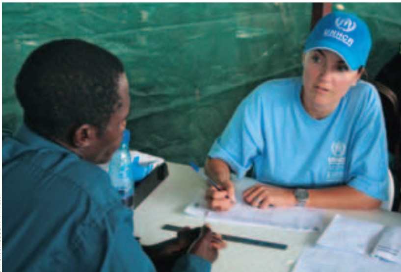
Djelatnica UNHCR-a registrira izbjeglicu iz Angole u susjednoj Namibiji.