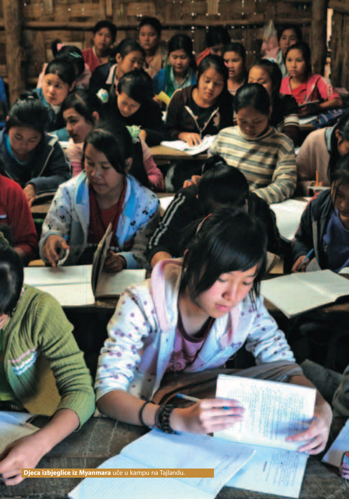
Djeca izbjeglice iz Myanmar uču u kampu na Tajlandu.